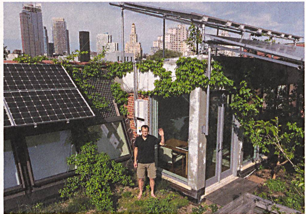
Microgrids, wie hier in Brooklyn, machen Bewohner unabhängig von grossen Energieerzeugern.