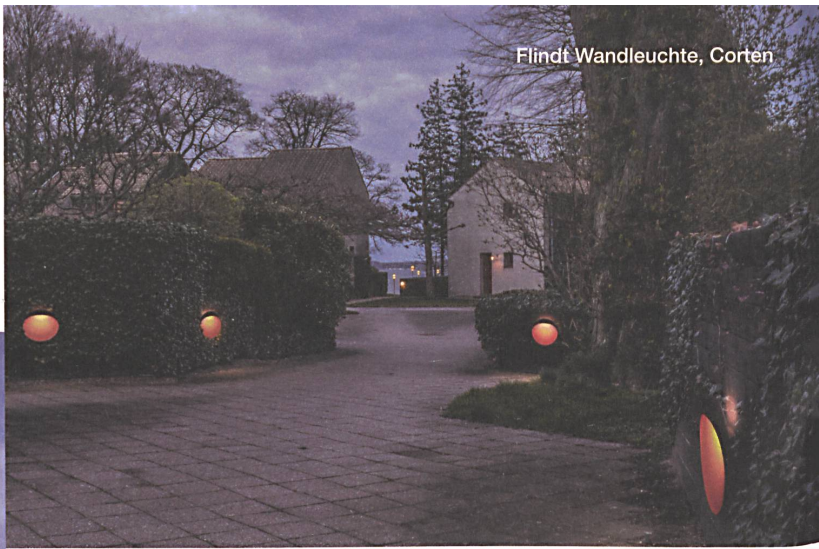
Flindt Wandleuchte, Corten