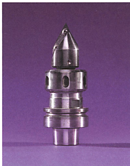
Spitzfräser | Fraise pointue | Fresa a punta