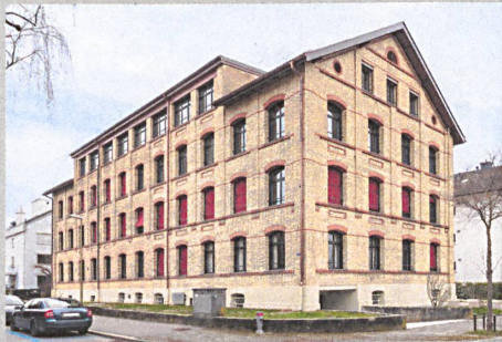
Von aussen präsentiert sich die ehemalige Schuhfabrik dem Umbau zum Wohnhaus fast unverändert.

Aus einer ehemaligen Schuhfabrik wurde in Winterthur ein zeitgemässes Mehrfamilienhaus. Eine nicht ganz unwichtige Nebenrolle spielt dabei der bequeme und hindernisfreie Zugang zu den 14 Wohnungen mit einem Lift vom Typ Magic.