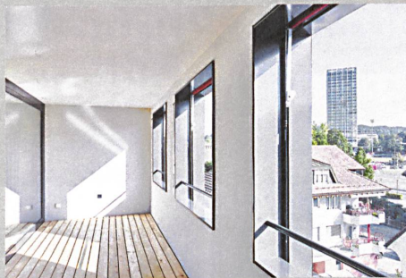
Von den Loggien der Dachwohnungen reicht der Blick übers Quartier zum bekannten Sulzer-Hochhaus.