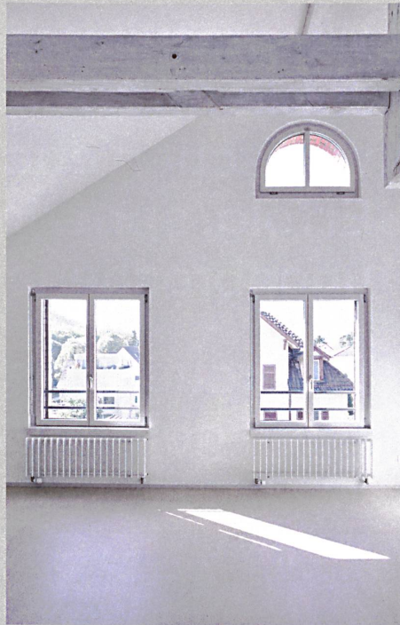
In den zwei Dachwohnungen konnten unter Einbezug des ehemaligen Estrichs überhohe Räume realisiert werden.