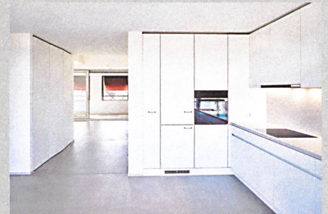
Helle Böden und weisse Einbaumöbel prägen die Optik der neu geschaffenen Wohnungen.