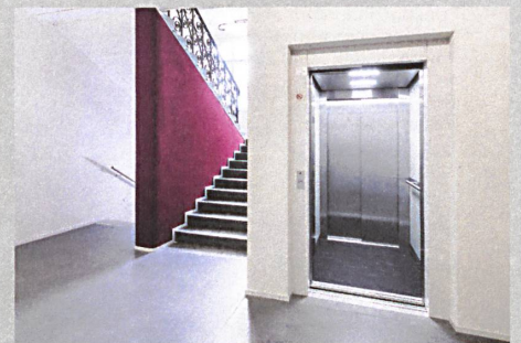
Eine farbige Wand setzt im Hochparterre einen Akzent im ansonsten schlicht gehaltenen Treppenhaus.

Text: Reto Westermann