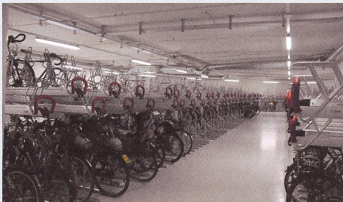
Velostation Centralbahnplatz, Basel

Nachhaltige Investition für maximale Auslastung, bei geringem Platzbedarf.