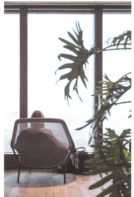
Im Dachgeschoss kann man sich erholen und die Aussicht geniessen.