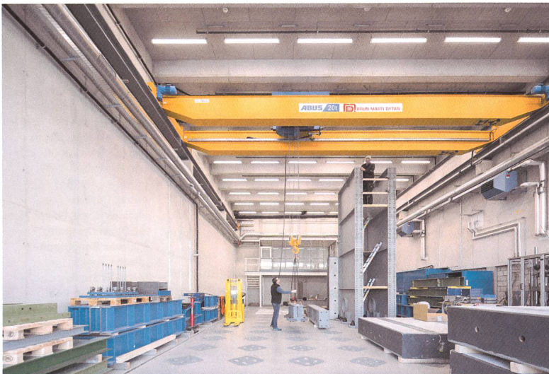
Ingenieure führen im Baulabor Belastungstests durch.

Ein dunkler Flur führt zu einer schwarzen Tür. In der Technikzentrale dahinter wird klar, dass in diesem Gebäude alles etwas grösser ist als normal: Die drei Meter hohe Klimatechnikanlage füllt den ganzen Raum, ein blauer Riese umschlungen von silbrigen Rohren. Die Doppelturhalle, die die App als Raum U2.O.01 anzeigt, hat hingegen eine vertraute Grösse. Es riecht nach Sport. Angehende Lehrerinnen und Lehrer spielen Volleyball, ihre Schuhe quietschen auf dem Boden. Ein Wendeltreppenlauf weiter oben im ersten Untergeschoss strampeln, wuchten und rennen Muskelmänner und -frauen im Fitnessraum, unterstützt von lauter Rockmusik. Im Gymnastikraum →