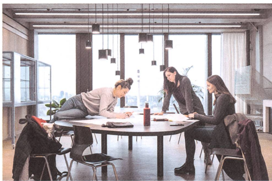
Die Tische in den Aufenthaltsräumen erinnern an eine Wohnung.