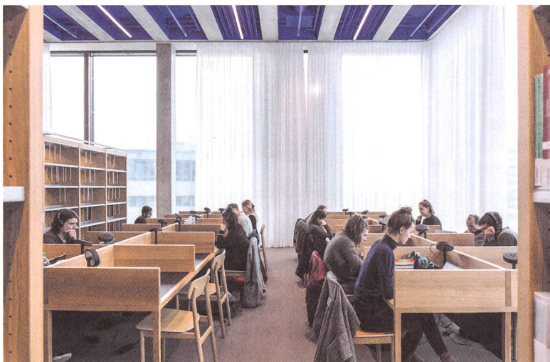
Das Bibliotheksgeschoss ist höher als die übrigen Stockwerke.

→ daneben finden vor der Spiegelwand Pilates-Stunden, Power-Yoga-Kurse oder Standardtanzunterricht statt. Alle Studentinnen und Studenten sowie die Mitarbeitenden des ganzen Hauses können das Bewegungsangebot über Mittag und am Abend nutzen.