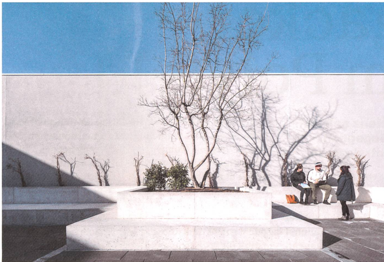
«Hortus conclusus»: Der Dachgarten öffnet sich nur zum Himmel.