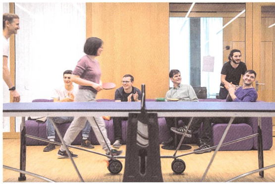
In den Empfangsräumen ist Platz für sportliche Abwechslung.