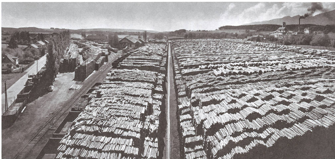
Der riesige Holzplatz der Cellulosefabrik lag am Südufer der Aare und fasste mehr als 400 000 Ster (1 Ster = 1 m 3 geschichtetes Holz inklusive Zwischenräume).

9 ehemalige Kläranlage 10 Neubau Biogen, Industriepark Attisholz Süd 11 Eisenbahnbrücke 12 Attisholz Nord, ehemalige Cellulosefabrik Plan: Mavo Landschaften