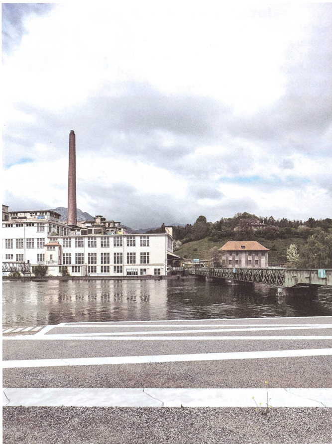
Grosser Platz im Zentrum des Uferparks Attisholz: Breite Stufen führen bis ans Wasser.