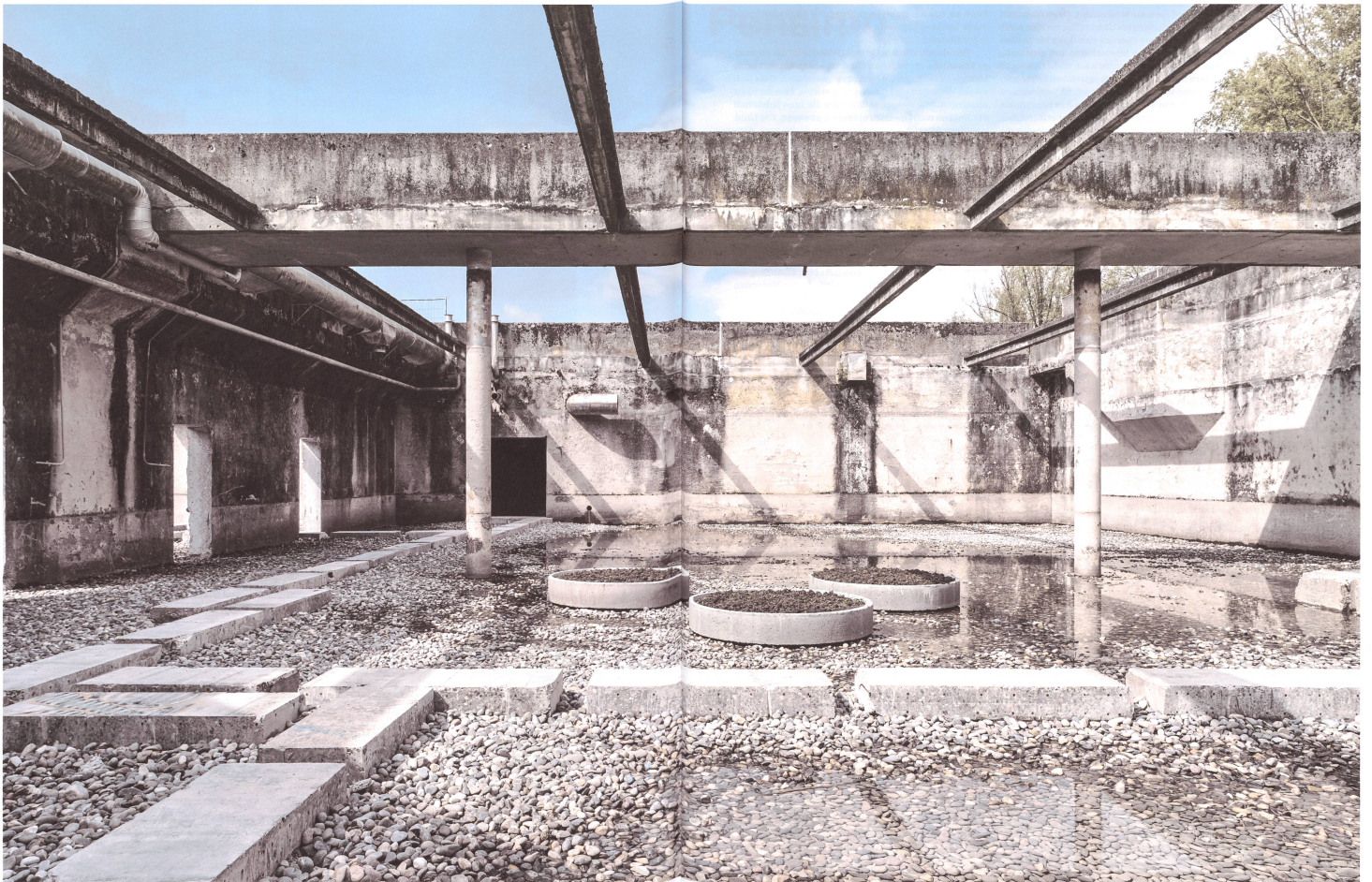
Ostdeutschland? Nein. Luterbach bei Solothurn, wo Landschaftsarchitektinnen und kantonale Zuständige den Mut hatten, eine alte Kläranlage als Teil eines Parks stehen zu lassen.