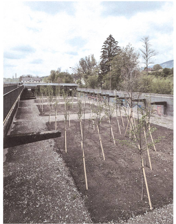
... und in die hinteren, wo ein junger Auenwald heranwächst. Links verläuft ein Steg auf der Mauerkrone.

→ wo die Fabrik in den Himmel wächst. Nach 120 Jahren prosperierender Firmengeschichte schliesst der norwegische Konzern Borregaard am 29. September 2008 die Cellulosefabrik, die er 2002 übernommen hatte. 450 Angestellte verlieren ihre Arbeit, übrig bleibt eine gewaltige Industriebrache. Überzeugt von der Bedeutung dieser Landreserve kauft der Kanton Solothurn 2011 35 Hektar des Südareals und prüft zusammen mit den Gemeinden Riedholz und Luterbach und den übrigen Grundstücksbesitzern die Umnutzung des gesamten Areals in einer Testplanung. Sie bringt drei Empfehlungen: Das Nordareal eignet sich für ein Wohn- und Gewerbegebiet, im Süden soll ein Industriepark entstehen und der Grünraum entlang der Aare zur Visitenkarte des auferstehenden Gebiets werden.