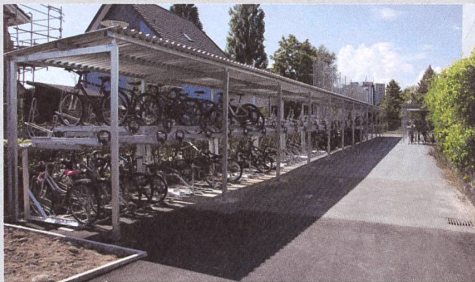
Schulhaus Lenzhard, Lenzburg

Nachhaltige Investition für maximale Auslastung, bei geringem Platzbedarf.