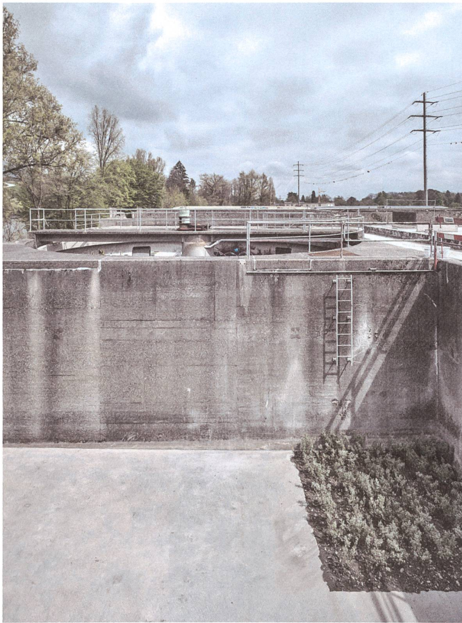
Blick in die vorderen Becken der ehemaligen Kläranlage ...