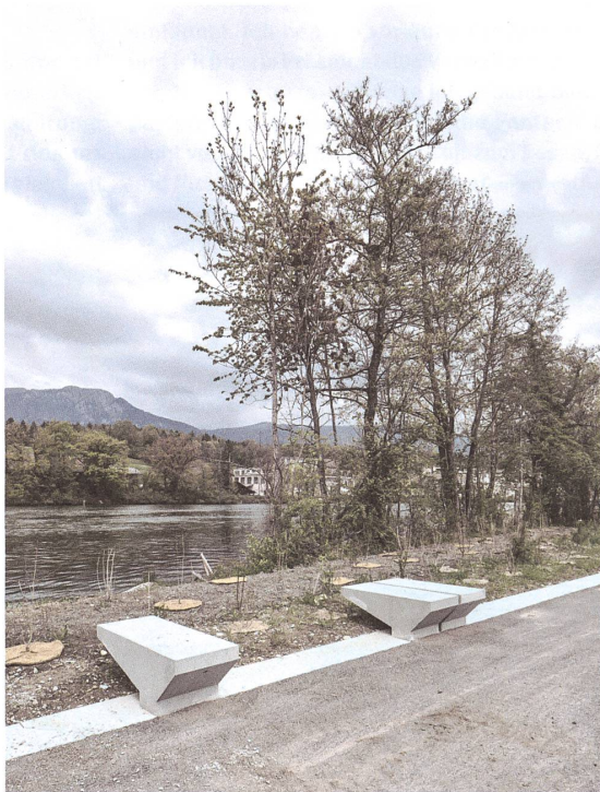
Wie Sprungbretter zur Aare: kleine Betonelemente als Bänke an der neuen Promenade, die den Park gegen Süden abschliesst.