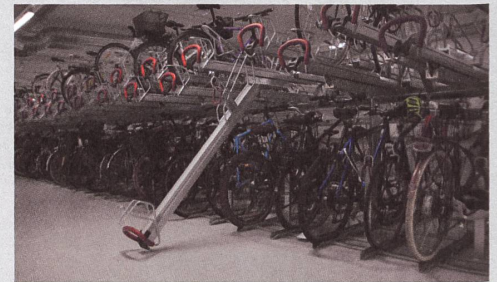
Bahnhof Basel, SBB

Schüler und Lehrer haben sich nach einer Testphase dreier unterschiedlicher Produkte, für den Easylift+500 ADFC von femapark® entschieden. Das einfache Handling dieses Systems kam auf Anhieb gut an. Der Schule standen bis anhin 150 Fahrradplätze zur Verfügung, was bei weitem zu wenig war. Mit dem Doppelstockparker femapark® Easylift+ ADFC konnten 488 Plätze realisiert werden. Dank der Möglichkeit die Handgriffe zu nummerieren, konnten die Plätze mit farbigen Nummern den einzelnen Schülern fix zugewiesen werden.