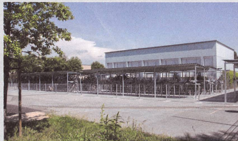
Schulhaus Lenzhard, Lenzburg