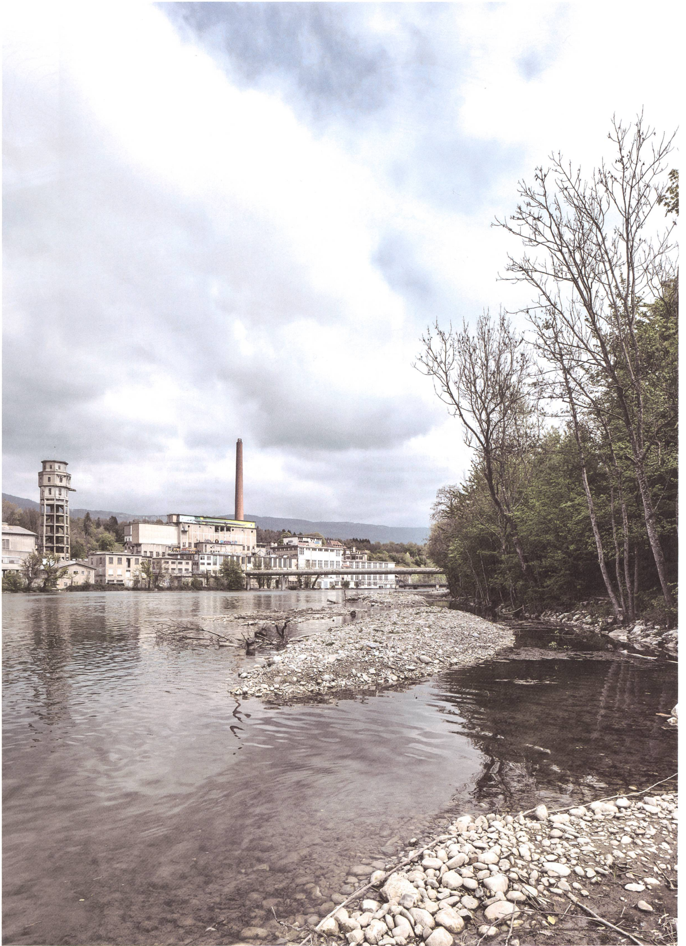
Vor dem Aareufer sind Kiesinseln aufgeschüttet, die vielfältige Laich- und Nistplätze bieten. Dahinter ragt der Industriekomplex der ehemaligen Cellulosefabrik Attisholz auf.