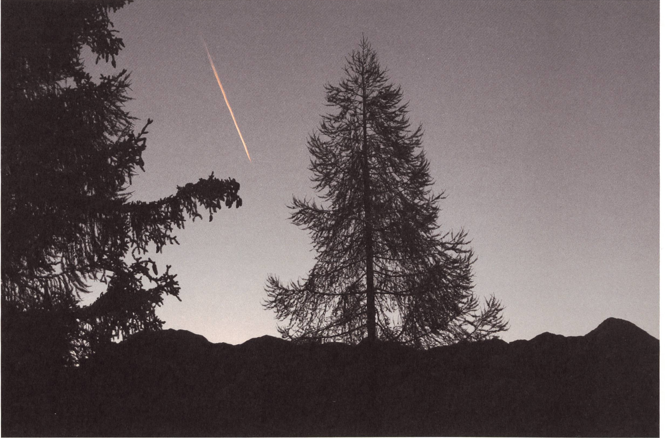
Morgenstimmung Strela- alpstrasse, Schatzalp Davos.