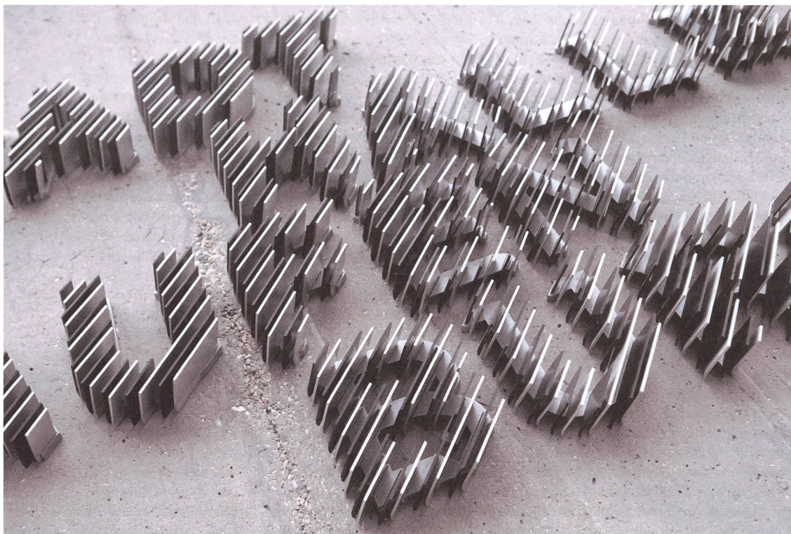
Mischa Leiners ausgeklügelte Buchstabenkonstruktion für den Schriftzug an der Stadthalle Laufenburg.