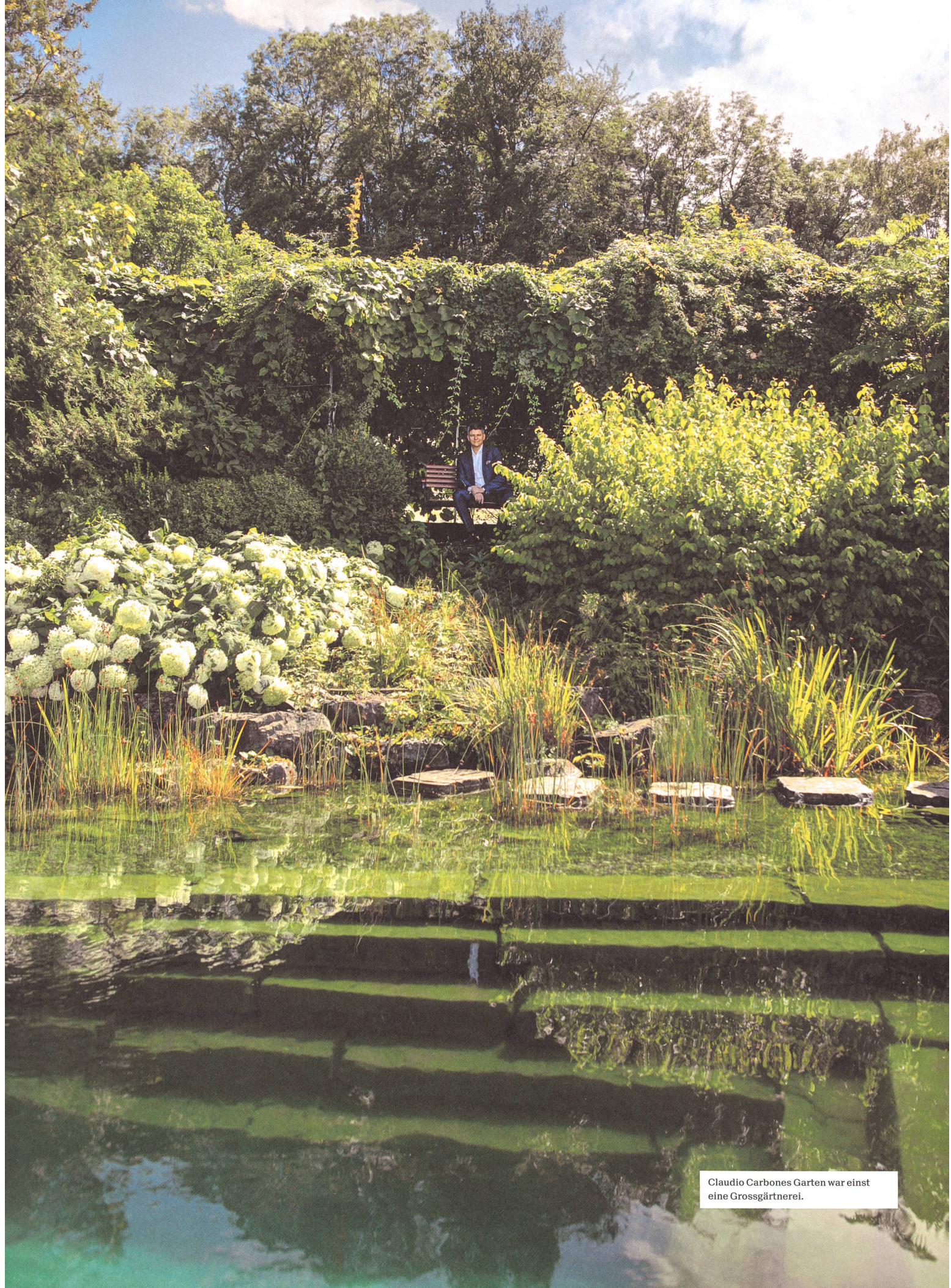
Claudio Carbones Garten war einst eine Grossgärtnerei.