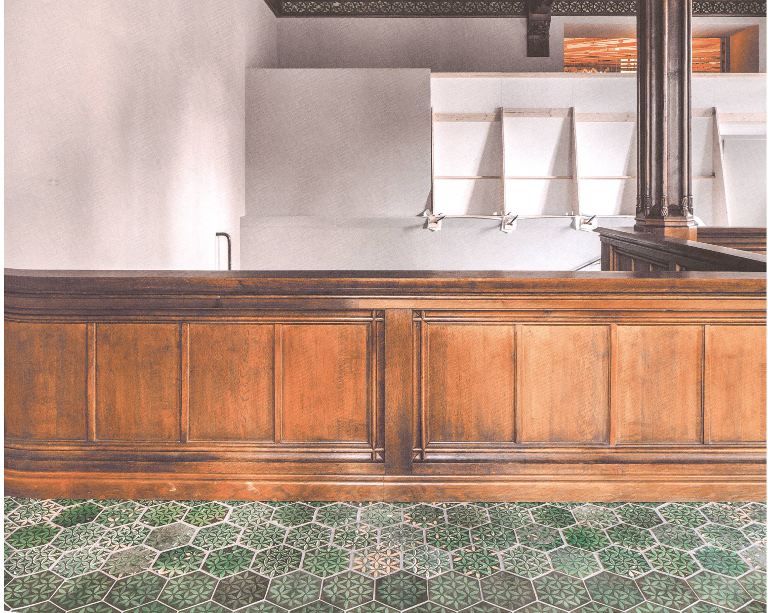
Patronierte Fliesen im Korridor mit der Decke aus dem Schloss Arbon: vorne rekonstruiert, hinten original.