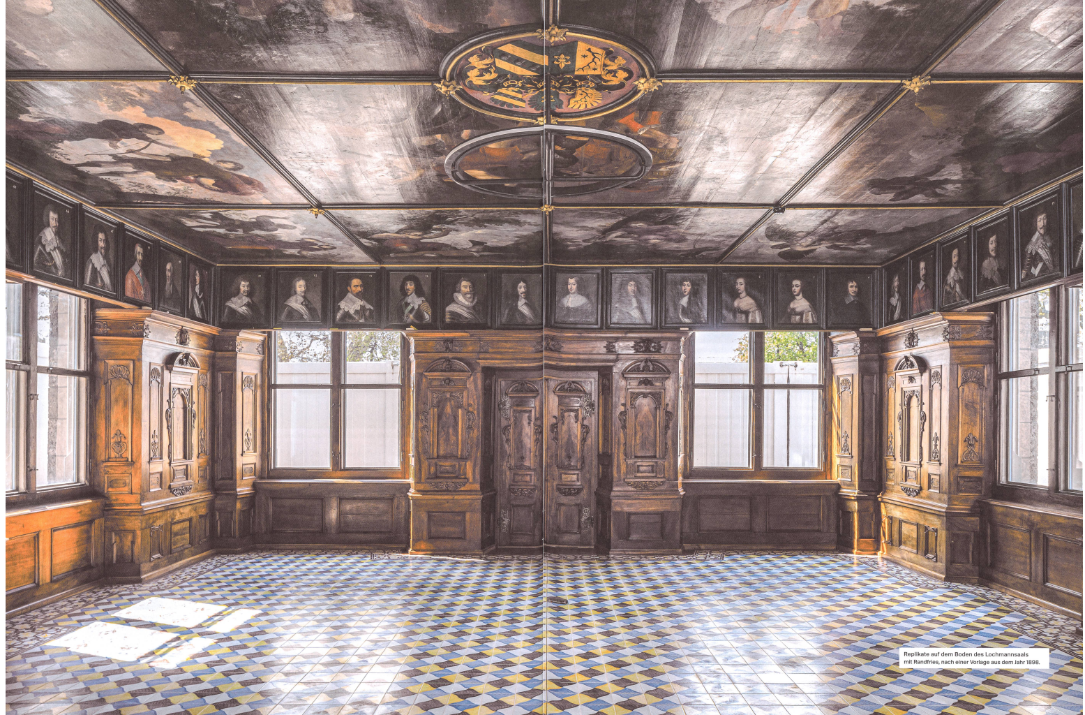
Replikate auf dem Boden des Lochmannsals mit Randfries, nach einer Vorlage aus dem Jahr 1898.