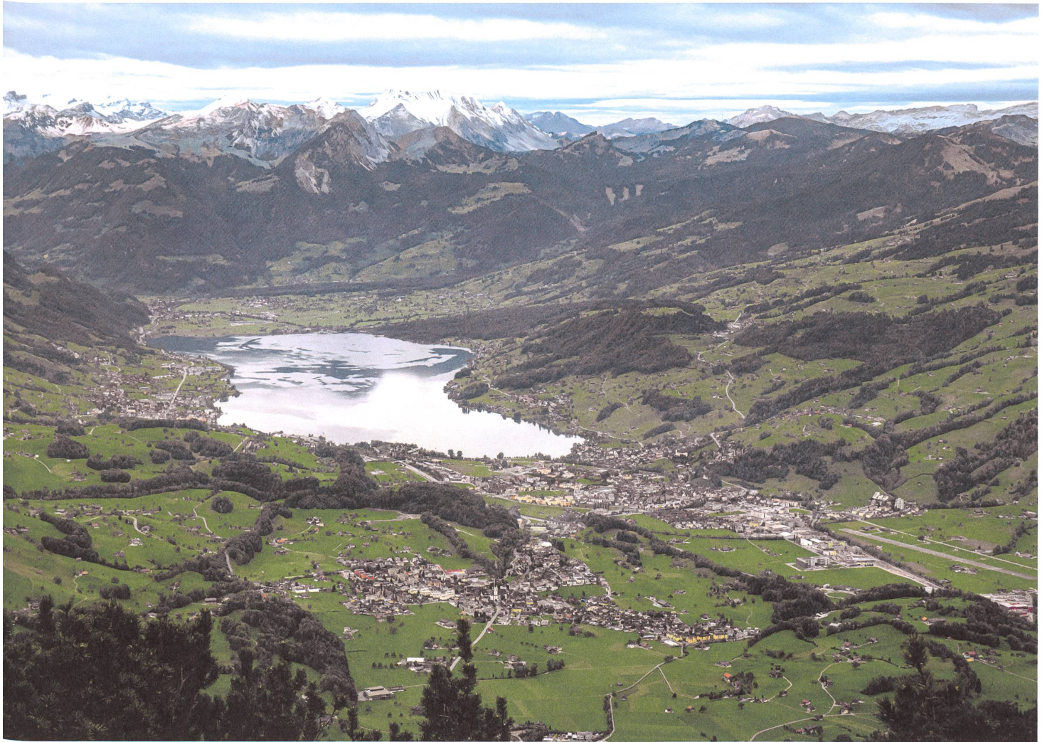
Die Hälfte der Bauten ausserhalb der Bauzone: Streusiedlungen brauchen Gestaltungsgebote. Blick auf den Sarnersee mit Sachseln (links), Kerns und Sarnen.