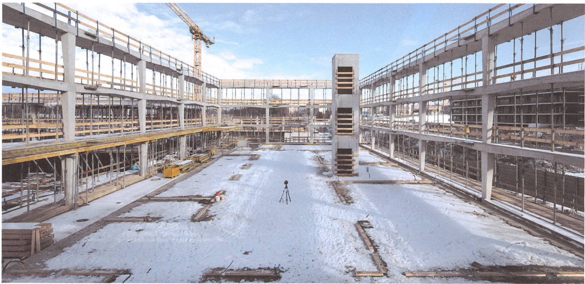
Zuerst wurden die Betonbalkone und der Liftschacht an Ort gegossen, anschliessend der Holzbau aufgestellt.