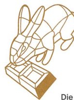
Die Jury sagt