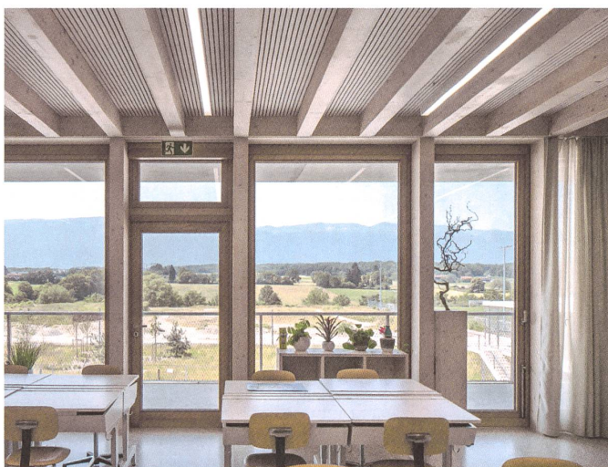
Aus den Zimmern geht der Blick nach draussen – hier nach Frankreich und zum Jura.

Schulanlage Les Vergers, 2018 Rue des Arpenteurs 7–13, Meyrin GE Bauherrschaft: Gemeinde Meyrin und Association La Voie Lactée Architektur: Sylla Widmann Architectes, Genf Bauleitung: M Architecture, Genf Bauingenieure: B+S ingénieurs conseils, Genf Kosten (BKP 1–9): Fr. 54 Mio.