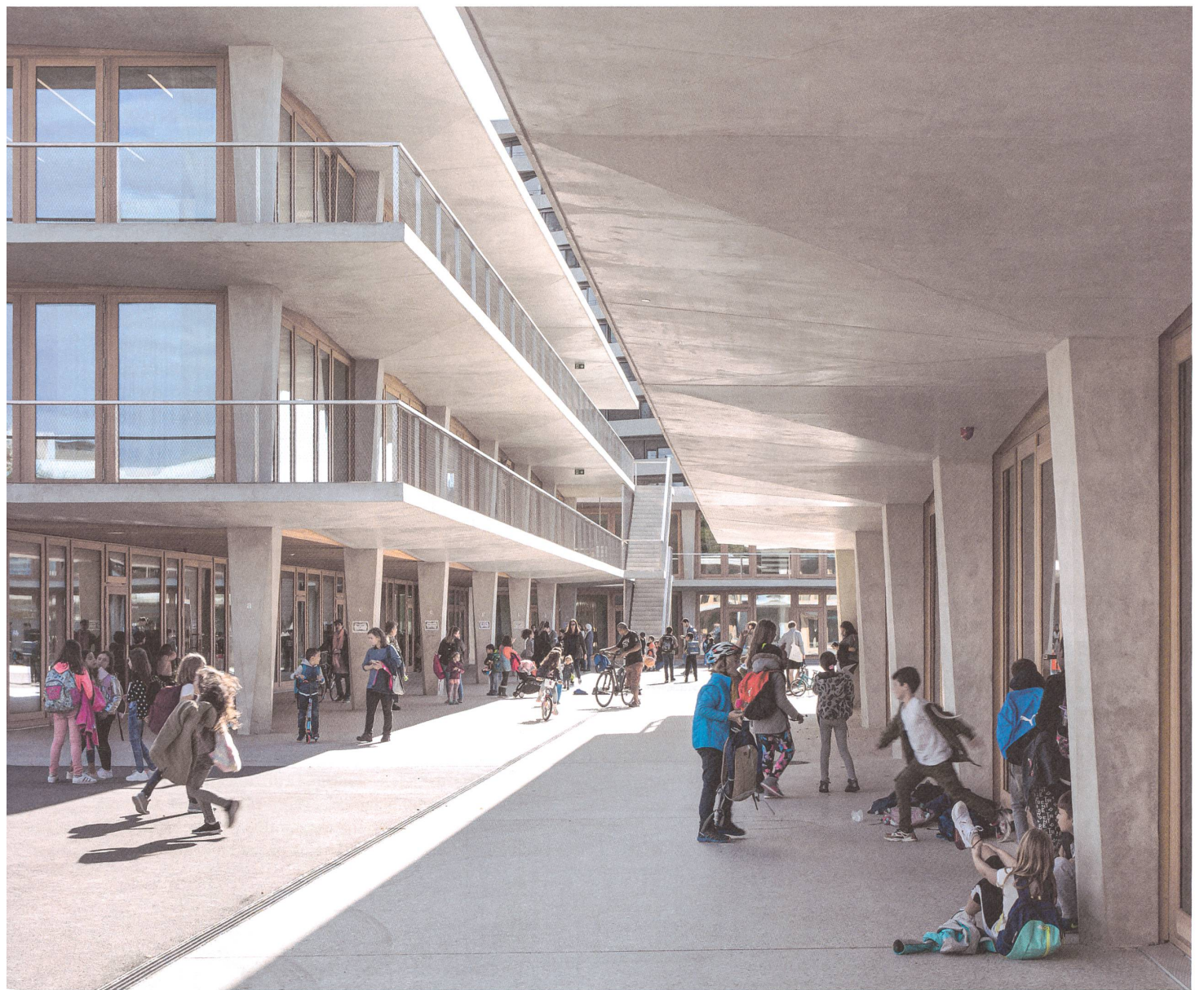
Die umlaufenden Betonbalkone prägen das Äußere der Schulanlage Les Vergers in Meyrin. Vier Gebäude erzeugen ein Geflecht von Höfen und Gassen.