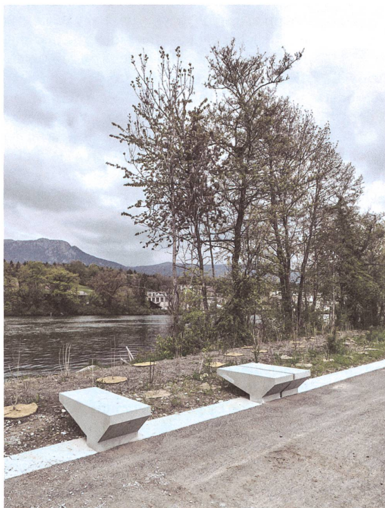
Schneisen öffnen den Blick auf das nördliche Aareufer und verbinden die neue Promenade mit dem Fluss.