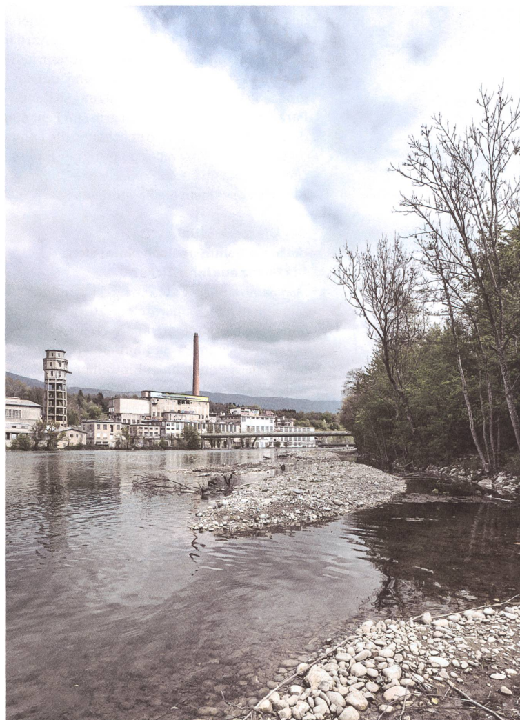
Vom renaturierten Ufer mit Kiesinseln und dichten Strauchpartien profitieren Wasser- und Zugvögel. Ihr Lebensraum steht unter internationalem Schutz.