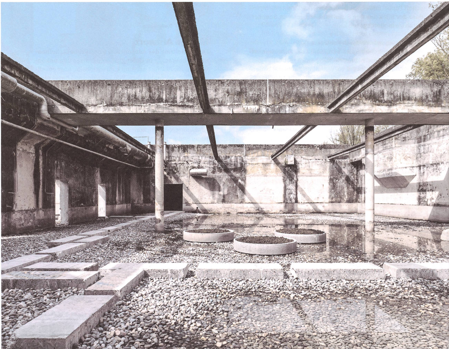
Pragmatisch und poetisch: In den ehemaligen Klärbecken der Zellulosefabrik Attisholz führen Trittsteine durch Kies- und Wasserflächen.

Text: Gabriela Neuhaus