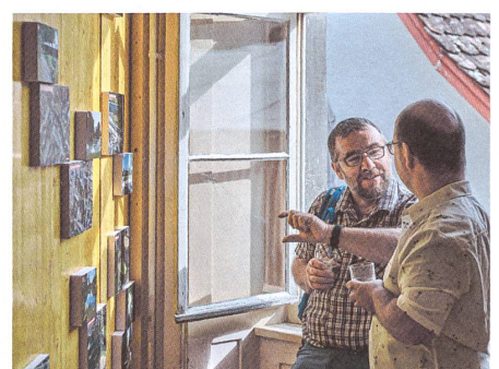
Das Studio Dietikon hat einen Stadtplanungsprozess intelligent choreografiert: Mit Workshops, Filmvorführungen, Ausstellungen, Publikationen, überraschenden Veranstaltungs- und Mitwirkungsformaten und einem festen Ort als Treffpunkt wurden die Bewohner wiederkehrend sensibilisiert und mobilisiert.