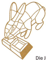
Die Jury sagt