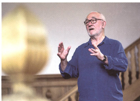
Gespräch in der Kirche Haldenstein: Peter Zumthor über Architektur und Klimakrise.