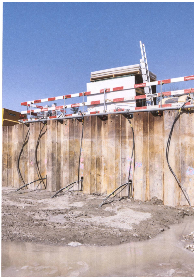
Zürich-Schwamendingen: Baustelle für die Wohnsiedlung Herzogenmühle.

Ersatzneubau Wohnsiedlung Herzogenmühle, Zürich, 2027 Bauherrschaft: Milchbuck Baugenossenschaft, Birmensdorf Architektur: Zimmermann Sutter Architekten, Zürich Leistungen b+p: Projekt- und Baumanagement, Kostenplanung, Terminplanung