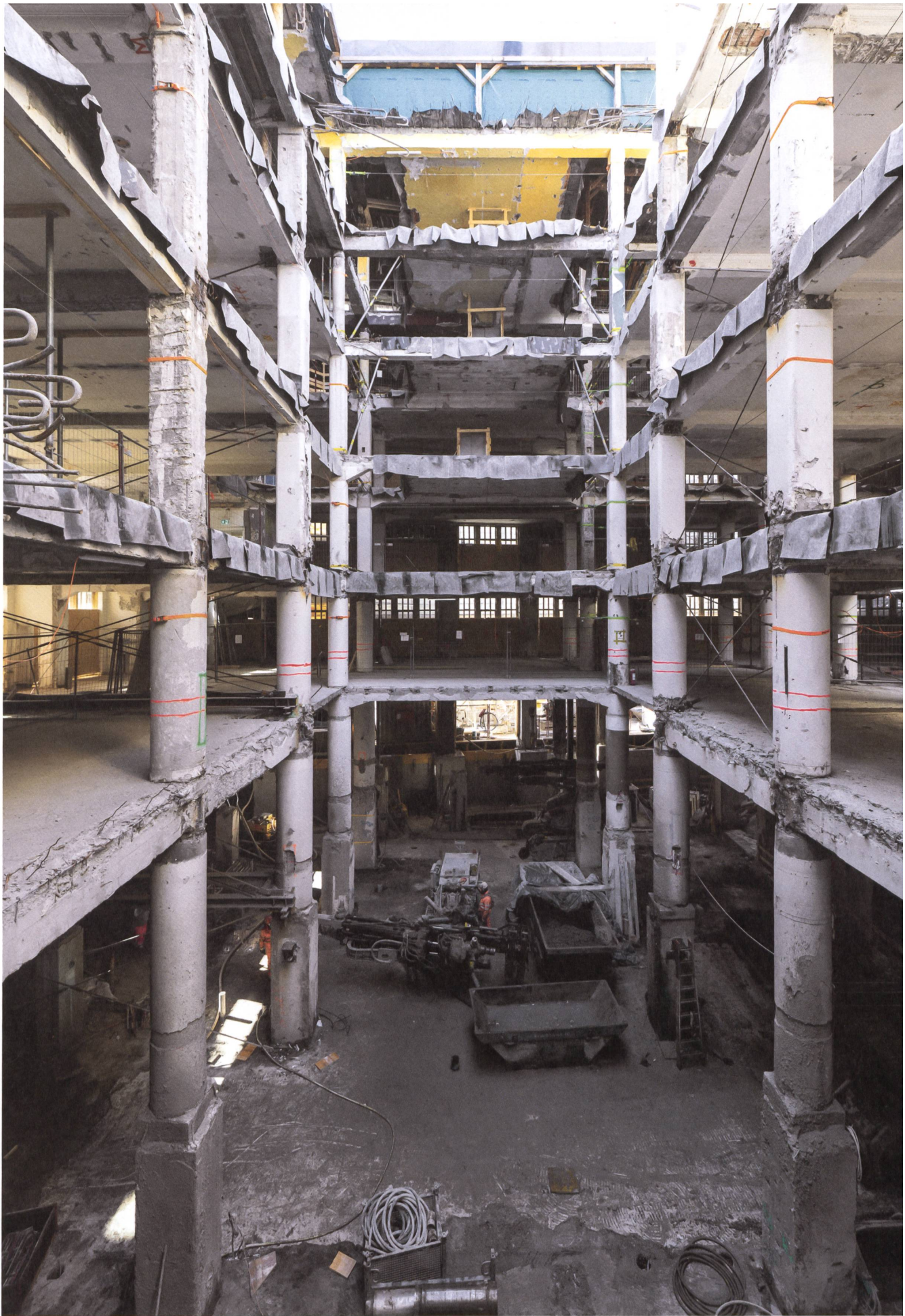
Zürich: Aus einem ehemaligen Warenhaus an der Bahnhofstrasse 75 wird das Geschäftshaus Brannhof.