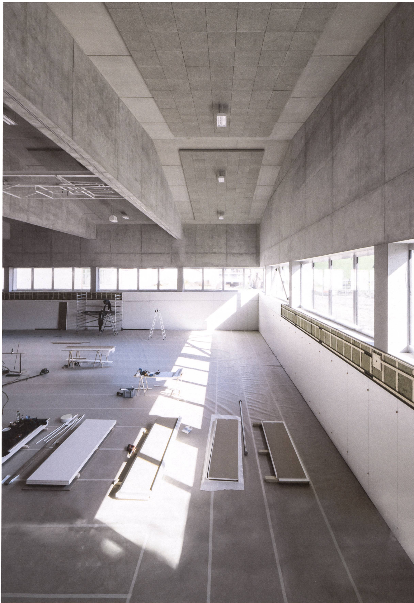
Niederweningen: eine neue Doppelturnhalle für die Schulgemeinde Wehntal.