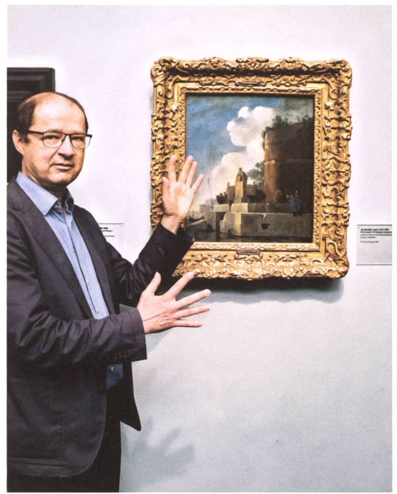
Philippe Büttner, Sammlungskonservator Jan Asselijn (1610–1652), «Hafenszene mit Galeerensklaven», um 1652