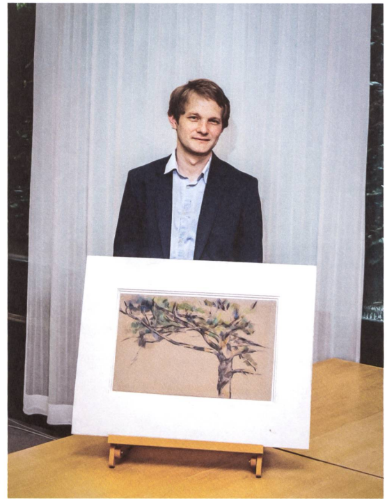
Jonas Beyer, Kurator Paul Cézanne (1839–1906), «Etude d'arbre. Le grand Pin», um 1890