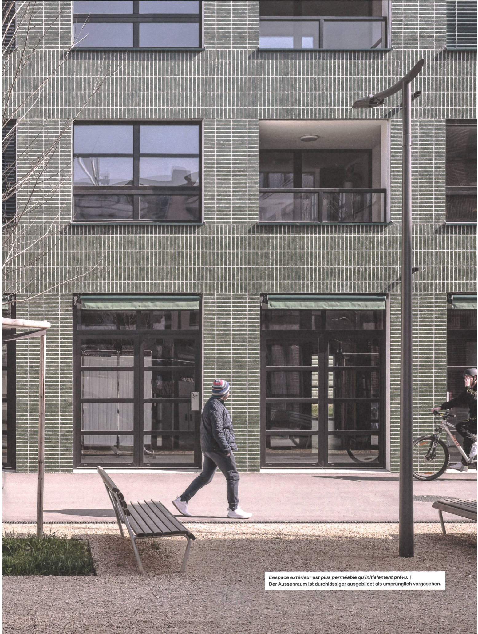
L'espace extérieur est plus perméable qu'initialement prévu. | Der Aussenraum ist durchlässiger ausgebildet als ursprünglich vorgesehen.