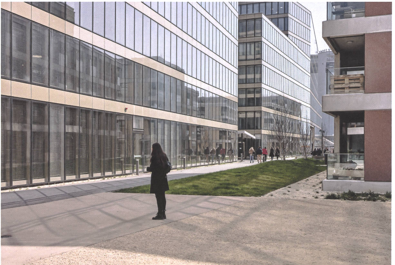
Des bâtiments en verre hébergent le siège des CFF et le centre de formation pour la Suisse romande. | Glasbauten mit SBB-Hauptsitz und Ausbildungszentrum Westschweiz.