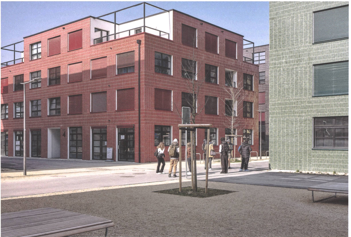
Un réseau de chemins et de places est tissé à travers le nouveau quartier. | Ein Netz von Wegen und Plätzen durchmisst das neue Quartier.