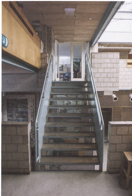
Treppen als Teil der kommunikativen Architektur in den Apollo-Schulen.