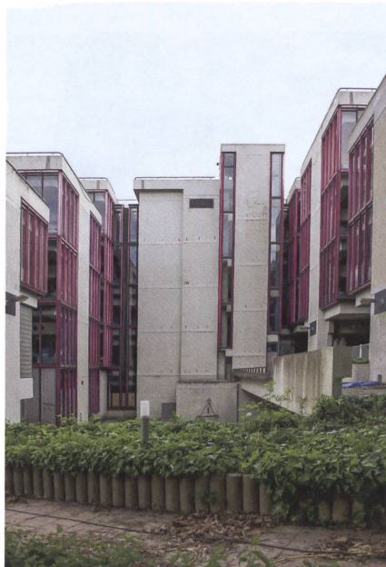
Zum Weiterbauen und Umnutzen gedacht: Centraal Beheer im Jahr 2022.