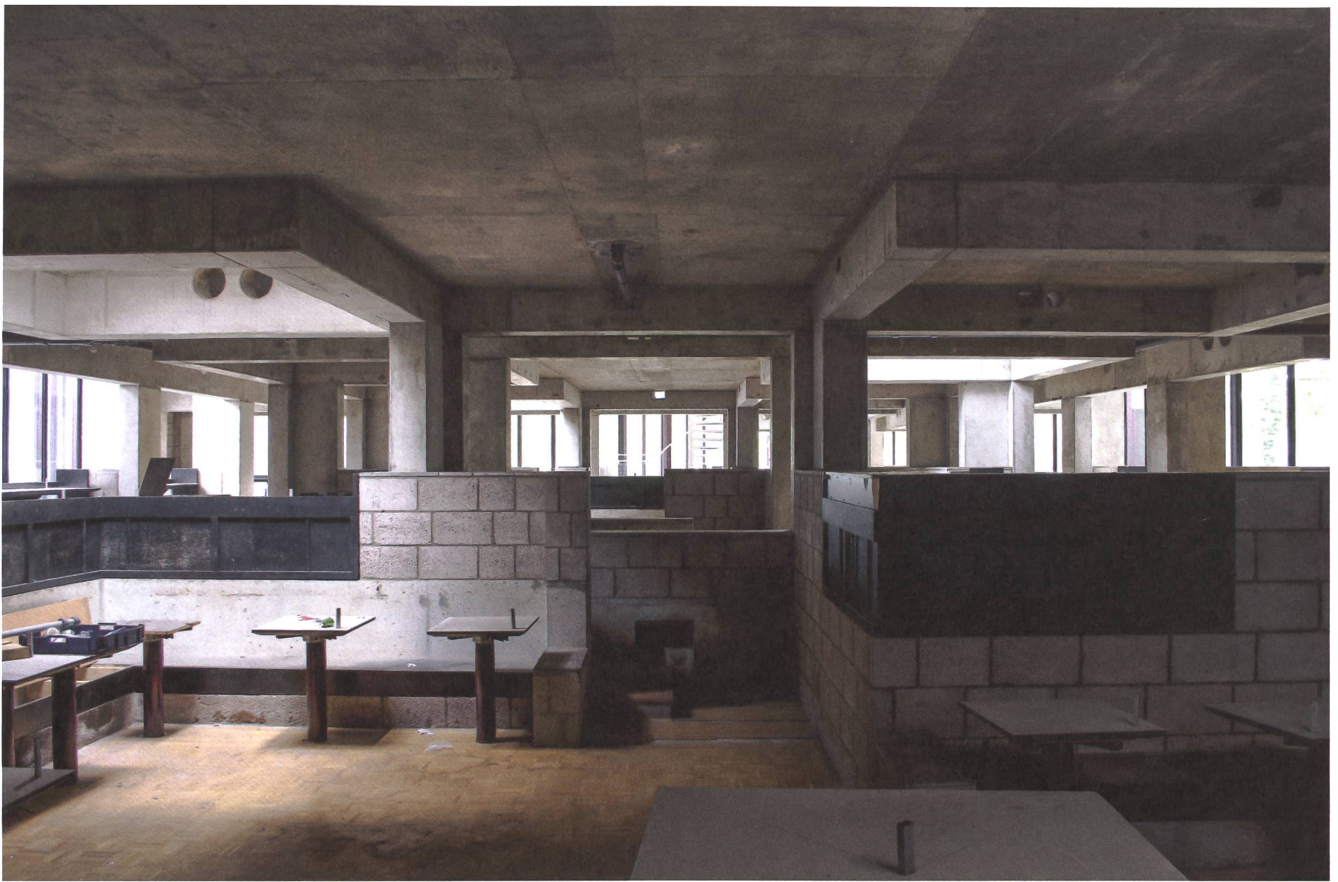
Verlassene Ikone des Strukturalismus: Aus dem Bürogebäude Centraal Beheer in Apeldoorn soll in den nächsten Jahren der Wohnkomplex Hertzberger Park werden.

→ gleichen sind. Die inzwischen historischen Bauwerke zu besichtigen, die in den Niederlanden unter der Bezeichnung Strukturalismus entstanden sind (als Architekten zu nennen wären neben Hertzberger natürlich Aldo van Eyck, aber auch Theo Bosch oder Piet Blom), ist eine merkwürdige Erfahrung. Man fühlt sich nämlich ständig in eine Wirklichkeit gewordene Visualisierung aus der aktuellen Schweizer Wettbewerbsszene versetzt. Stellt man sich anstelle des Betons eine Holzstruktur vor, sind die Parallelen verblüffend – von der äusseren Erscheinung, die lieber offenes Raumgefüge sein will als repräsentative Form, über die Vorliebe für 45-Grad-Geometrien, Kreisformen, strukturiert-organische Grundrisse und gezielt gesetzte Signalfarben bis hin zur Omnipräsenz des Laubengangs. Letzterer steht wohl symptomatisch für die kollektivistische Wende, von der die Schweizer Architektur ergriffen wurde und die insbesondere beim genossenschaftlichen Wohnungsbau handfeste Folgen zeitigt. Galt der Laubengang noch vor wenigen Jahren als erschliessungstechnische Notlösung mit nicht zu tilgenden Nachteilen für die dahinter liegenden Wohnungen, ist er heute zum Signum einer für Nachbarschaftsbeziehungen und Gemeinschaftlichkeit sensibilisierten Architektur geworden, zum Inbegriff all der Begriffe, die den aktuellen Diskurs bestimmen: In-Between, Sharing, Partizipation.