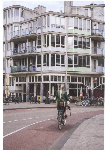
Amsterdamer Symphonie aus Balkonen: Wohnbaukomplex Pentagon von Theo Bosch und Aldo van Eyck.