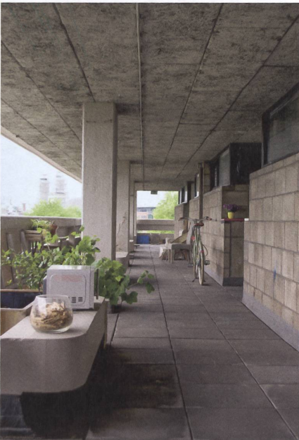
Der Laubengang als Gemeinschaftsraum: Hertzbergers Studentenwohnhaus in Amsterdam.