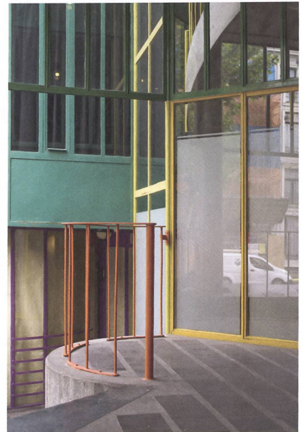
Schwellenraum aus Farben und Formen: Aldo van Eycks Hubertushuis in Amsterdam.