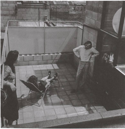
Hier konnte man selber weiterbauen: Diagoon-Häuser in Delft, 1971.