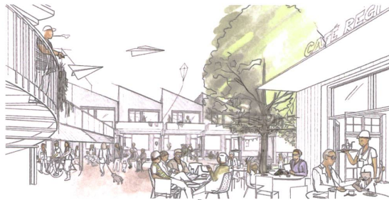
Einst Fabrik, bald Dorfzentrum.