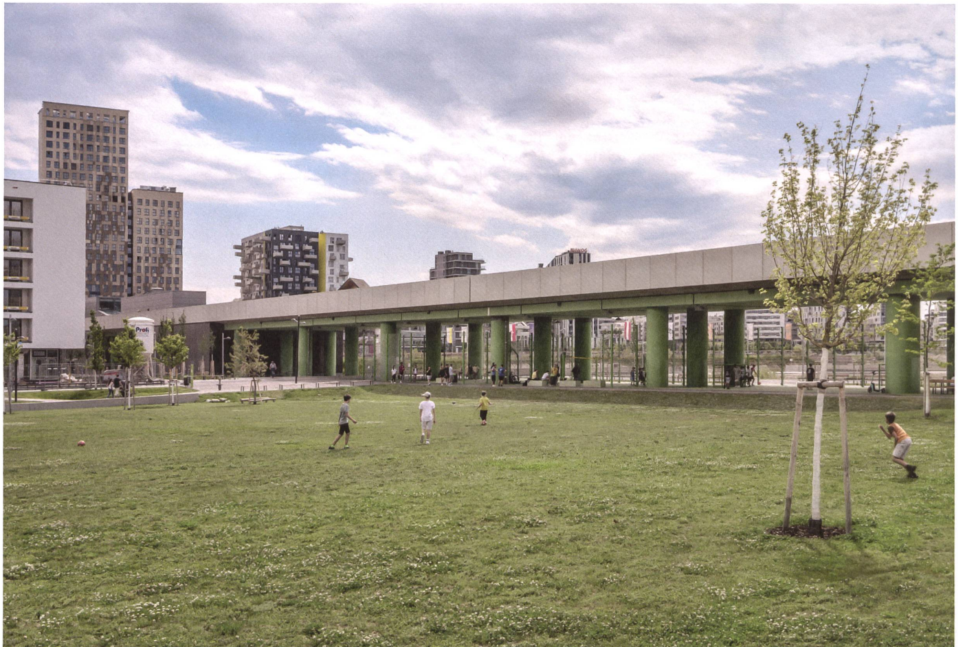
Gewachsenes und gebautes Grün: Am Elinor-Ostrom-Park nehmen die Säulen des Bahntrassees die Farbe des Rasens auf.