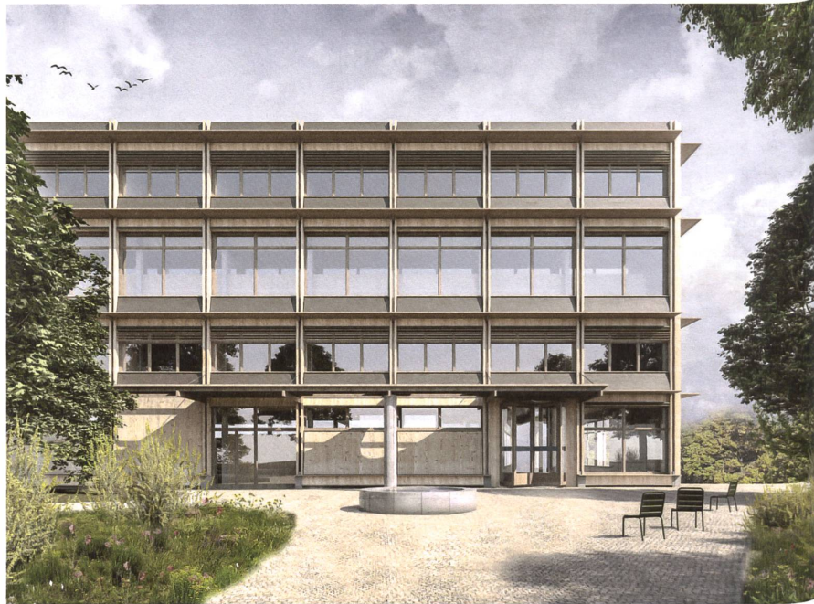
Die grosse Überraschung: Statt eines Achtungserfolgs gabs für Koya beim offenen Wettbewerb für das Bezirksgericht Hinwil im Kanton Zürich prompt den ersten Platz.

Das Gericht befindet sich noch nicht einmal im Bau, und schon denken Koya weiter: Wäre ein Satteldach besser gewesen? Hätten wir mehr auf Lowtech setzen sollen? Was, wenn die Bauherrschaft Gips- statt Lehm- bauplatten will? Wie auch immer alles endet: Koyaanisqatsi ist Teil einer Trilogie. Auch bei Koya dürfte ein gutes Sequel folgen. Obwohl die drei Architekten unisono sagen: «Nicht zu bauen, ist oft die beste Lösung.»