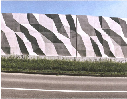
Stützmauer mit Tiefenwirkung: Projekt «Riederberg» im Kanton Freiburg.