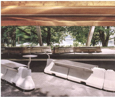
Mit Blech und Rohr wird der Strassensperren-Block zum Mobiliar für die Raststätte.

Etwas später, kurz hinter Freiburg, passieren wir eine 100 Meter lange Betonstützwand, in deren Facetten Licht und Schatten spielen. Als das Tiefbauamt die Strasse von der nahen Schlucht weg und in den Hang hinein verschob, erschrakten die Beamtinnen darüber, welche gewaltige Mauer unterhalb des idyllischen Weilers Riederberg entstand. Als Urbanisten mandatiert, änderten Baraki die Geometrie in zwölf identische Bogensegmente. So musste man bloss acht Schaltafeln in Standardgrösse mit Blechen ausstatten, um das Relief etappenweise zu schalen. Es ist zehn Zentimeter tief und nach links geneigt. «Das ist ein optischer Trick für mehr Tiefenwirkung», sagt Holz und findet: «Eigentlich ist die Wand eine Hommage an die frühe Land-Art, gepaart mit Engineering.» ●