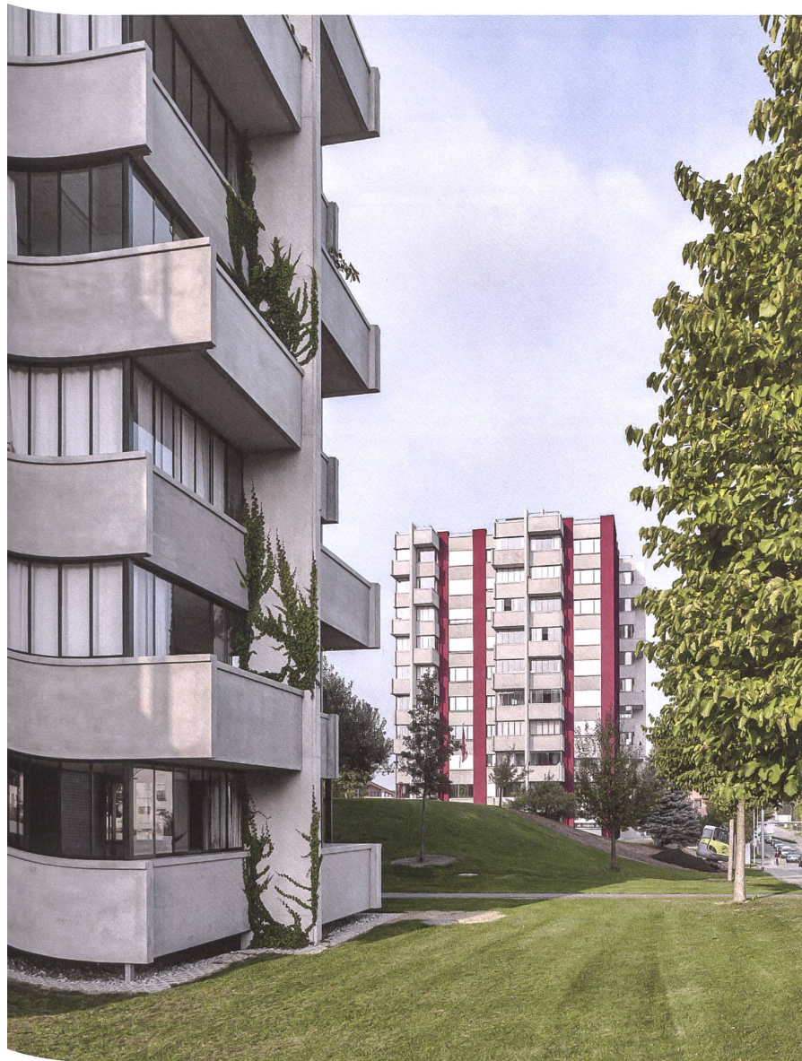
AM Architects haben die Fassade dreier Hochhäuser aus den 1970er-Jahren in Rotkreuz saniert.