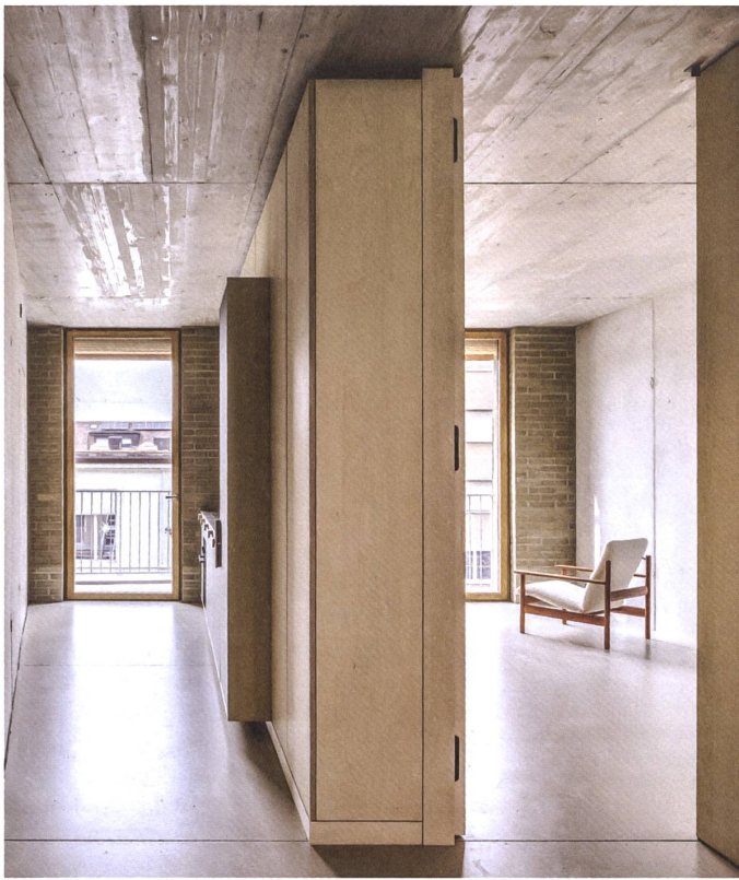
Lehmsteine, Sichtbeton und Holz prägen den Genossenschafts-Neubau auf dem Lysbüchel-Areal in Basel.