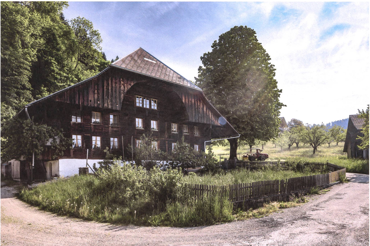
Das alte Bauernhaus mit Stöckli, Spycher und Schopf wird von den künftigen Siedlungsbewohnerinnen genutzt.