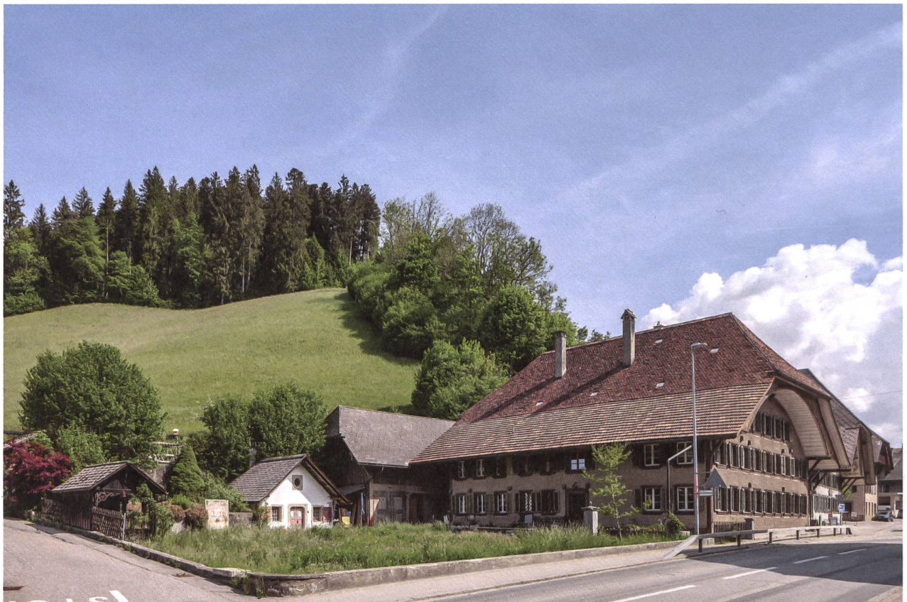
Das Mauerhoferhaus in Trubschachen: Im früheren Wohnsitz eines reichen Käsehändlers trifft sich heute die Genossenschaft Sonnhas.