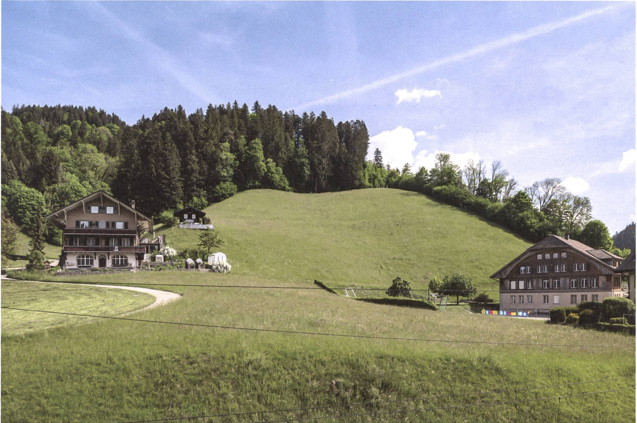
Das Grundstück der geplanten Siedlung liegt zwischen Weg und Schulgelände. Vorn fällt der Hang zur Bahnstrecke ab.