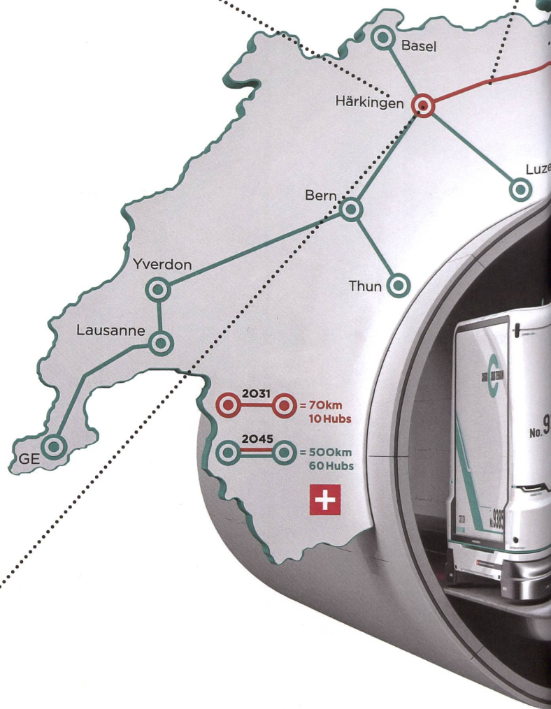
Vom Güterstrom durchbohrt: das Schweiz-Bild von «Cargo Sous Terrain». Visualisierung: Cargo Sous Terrain