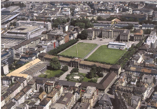
Luftaufnahme des Kasernenareals, 1997.