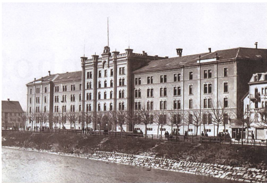
Die Kaserne 1895, noch ohne Militärbrücke.