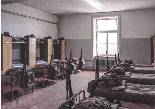
Schlafsaal der Infanterie-RS im 4. Obergeschoss, 1986.