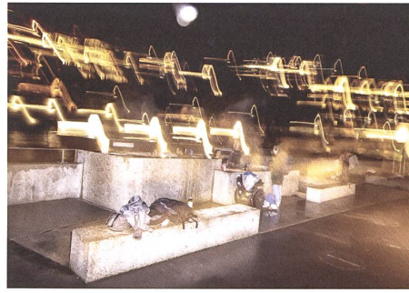
Ausgelassen, aber rücksichtsvoll: Die meisten Badegäste tragen den Brunnen und ihrer Umgebung Sorge.

Mitten in der Stadt im Badekleid in den warmen Brunnen sitzen: Was bis in die frühe Neuzeit selbstverständlich war, ist dank dem Verein Bagni Popolari und den Gemeinden Baden und Ennetbaden wieder möglich. Der radikale Ruf nach Wiederaneignung des öffentlichen Guts (in diesem Fall des Thermalwassers) hat sich gelohnt. Mit den «Heissen Brunnen» wurde ein Angebot geschaffen, das es so bis jetzt in der Schweiz nicht gab und das Schule machen könnte. Der Beitrag der Landschaftsarchitektur ist essenziell für das Gelingen des Ortes, denn es musste eine Gestalt für die Idee des öffentlichen Bads gefunden werden. Die «Heissen Brunnen» zeigen, wie kollektives Engagement und gestalterischer Anspruch zu neuen öffentlichen Raumqualitäten führen können. Vielleicht wäre mehr «Bagno popolare» noch besser? Die Nutzung der Becken ist intensiv, ein extensiveres Aneignen des Limmtraums wäre wünschenswert. Das Projekt zeigt beispielhaft, dass Planungsaufgaben in der Landschaftsarchitektur selbst gestellt werden müssen.