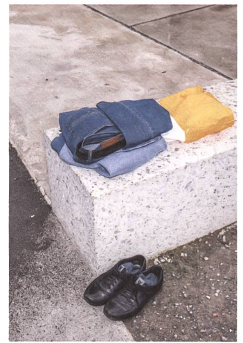
Sich im Freien umzuziehen, gehört an den «Heissen Brunnen» zum Baderitual.