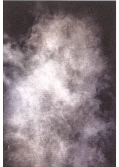
Gegen 22 Uhr löst sich die feuchtfrohliche Badegesellschaft in Luft auf.