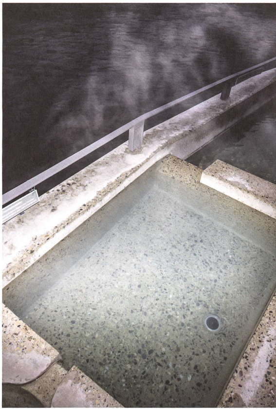
In die Brunnen fließt naturbelassenes Thermalwasser. Die Mineralien trüben das Wasser und lagern sich an den Beckenrändern ab.