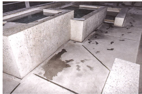
Die drei Becken des Badener Brunnen aus geschliffenem Beton.