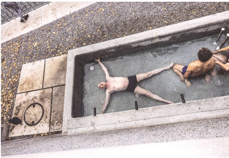
Schon während der Brunnen sich nach der Reinigung wieder füllt, entspannen die ersten Badegäste im noch flachen Wasser.