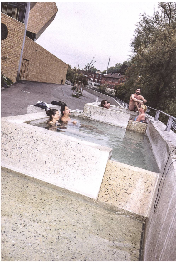
Öffentliche Badebecken gehörten in Baden jahrhundertlang zum Stadtbild. Dank dem Verein Bagni Popolari lebt die Tradition neu auf.