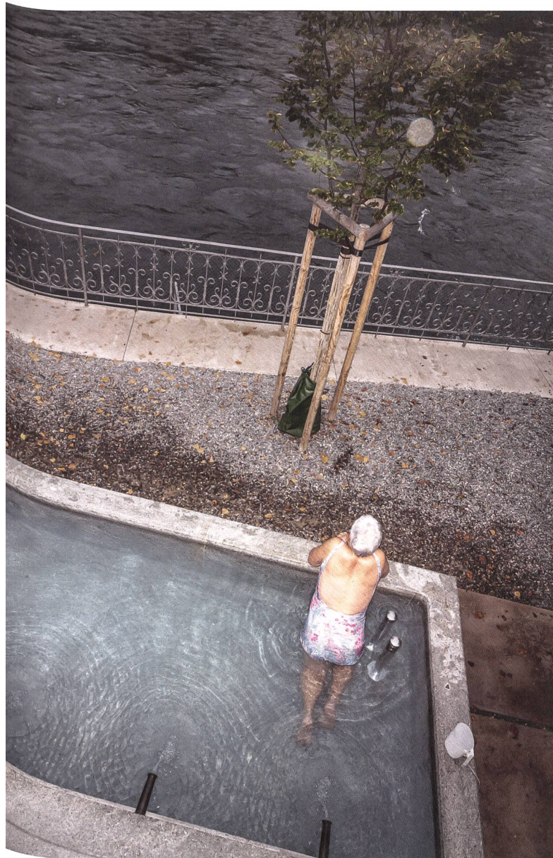
Der Brunnen in Ennetbaden besteht aus massivem Mägenwiler Muschelkalk.