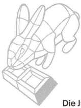
Die Jury sagt