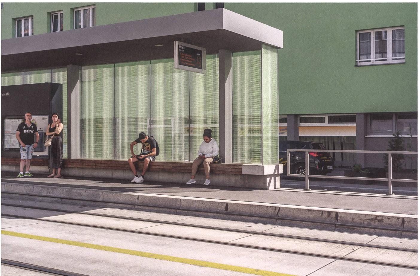
Zürich: Die Haltestelle Micafil zeugt von einem ehemaligen Industriebetrieb. In der Verglasung des Wartebereichs erzeugt die Sonne ein Lichtspiel. →

Auch der Industriestandort Limmattal geriet unter Druck. Die Schliessung der traditionsreichen Wagons- und Aufzügefabrik Schlieren 1985 war ein Schock über den Ort hinaus – und es blieb nicht der einzige: Geistlichs Leim- und Düngerfabrik «Lymi», die Stückfärberei «Färb» und das Gaswerk «Gasi» machten ebenfalls dicht. Es begann eine Abwärtsspirale, die 2003 ihren Tiefpunkt erreichte. «Leben im Abfallkübel des Kantons» betitelte der «Tages-Anzeiger» einen Beitrag über Schlieren. Die Behörden hatten die Zeichen der Zeit bereits erkannt und die Zukunft des Orts in die Hand genommen. Leitbild und Stadtentwicklungskonzept waren Stationen auf dem Weg zur Besserung. Am augenfälligsten – und für das städtische Selbstverständnis am wichtigsten – ist die Umgestaltung des Zentrums. Dabei nutzten die Stadtentwicklerin und die Planer geschickt – und so konsequent wie nirgendwo sonst – die Dynamik, die die Planung der neuen Bahn ins Limmattal mit sich brachte. ●