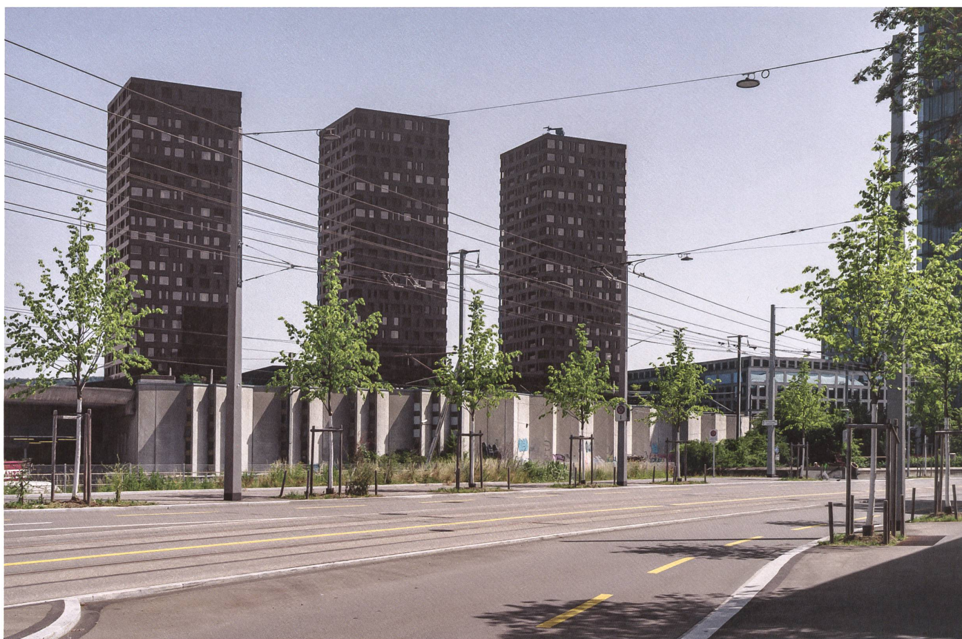
Zürich: Zwischen Seidelhof und Farbhof überragen die Türme der Überbauung Vulcano das Trasse. Hier verkehrt auch der Trolleybus, weshalb es nicht begrünt ist. →

Nach dem Shoppingcenter wollten die Investoren in Spreitenbach mit dem Tivoli noch höher hinaus. Es sollte mehr sein als ein Einkaufszentrum: ein Komplex mit vielfältigen städtischen Funktionen, einem Hotel und Wohnungen, einem Kongresszentrum und einem Mehrzwecksaal. Doch kaum war 1974 das erste Fragment des Tivoli – ausgerechnet das Einkaufszentrum – eröffnet, ging die Bauherrschaft in Konkurs. Die Ölkrise hinterliess ihre Spuren. Die Wachstumseuphorie war dahin, und Grosssiedlungen wie