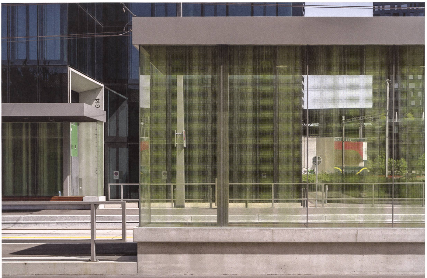
Zürich: An der Haltestelle Seidelhof dominieren klare Kanten – die der Wartehalle und die der Bauten im Hintergrund. →