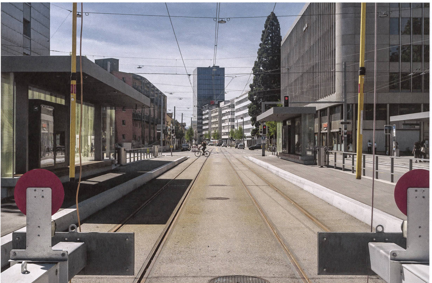
Zürich: Von den Prellböcken aus geht der Blick Richtung Westen ins zunächst städtisch geprägte Limmattal. →

Länge des Tals: Gerade mal 36 Kilometer legt der Fluss zwischen der Quaibrücke in Zürich und der Mündung in die Aare in Lauffohr bei Brugg zurück. Zehnmal länger ist der Schweizer Abschnitt des Rheins, achtmal länger die Aare. Dafür müssen die Zürcher «ihre» Limmat nur mit einem Kanton teilen, dem Aargau. Die Kantonsgrenze hat ihren heutigen Verlauf erst seit der Gründung des Kantons Aargau 1803. Zuvor hatte sogar für kurze Zeit ein Kanton Baden existiert, zu dem auch Dietikon, Schlieren und Hütikon gehörten. Mit dem Ende der Helvetischen Republik kamen diese Gemeinden zum Kanton Zürich. →