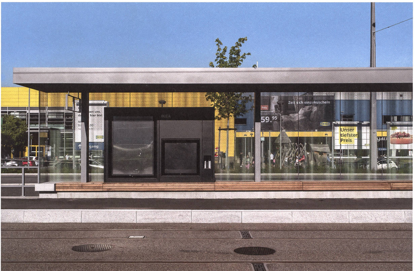
Spreitenbach: Bei der Haltestelle Ikea setzen das Gelb und das Blau im Hintergrund der Warthalle einen schwedischen Akzent. →

Mit einem Sitz im Lenkungsausschuss und durch Begleitgruppen für spezifische Fragestellungen wurden die Stakeholder ab 2010 aktiv in die Projektierung einbezogen. Früh stand man auch mit Organisationen wie Pro Velo, dem Verein Fussverkehr Schweiz, der Behindertenkonferenz →