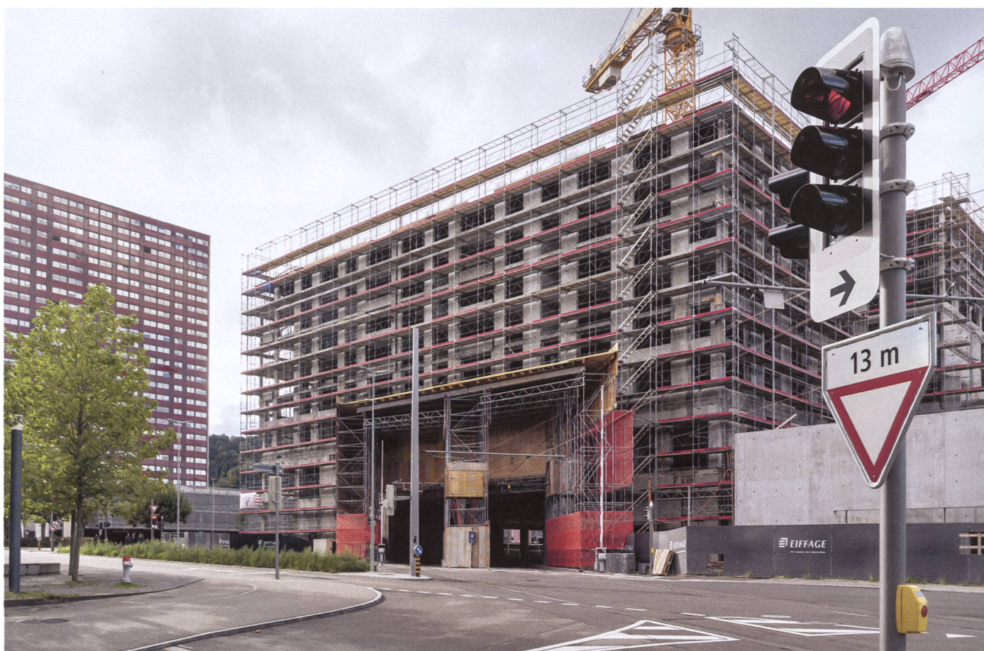
Spreitenbach: Zurzeit wächst über dem Bahntrasse der Tivoli Garten empor. →

Der eigentliche Bau der Limmattalbahn folgte in einem zweiten Schritt. Da dafür nur wenige spezialisierte Firmen infrage kamen, wurden die Planung und die Umsetzung einzelner Gewerke und der Gesamtstrecke an insgesamt vier Totalunternehmer vergeben. Diese Mandate umfassten den Gleisoberbau, den Bau der Haltestelleninfrastruktur, die Erstellung der gesamten Bahnstromversorgung sowie die Montage der Fahrleitung. In zwei weiteren speziellen Losen wurden Planung und Erstellung von Lichtsignalanlagen und Verkehrssteuerung sowie die Planung und Umsetzung des Depots siehe Seite 24 vergeben. Für dieses erhielten mehrere Einzelunternehmer die Aufträge für die Bauarbeiten. ●