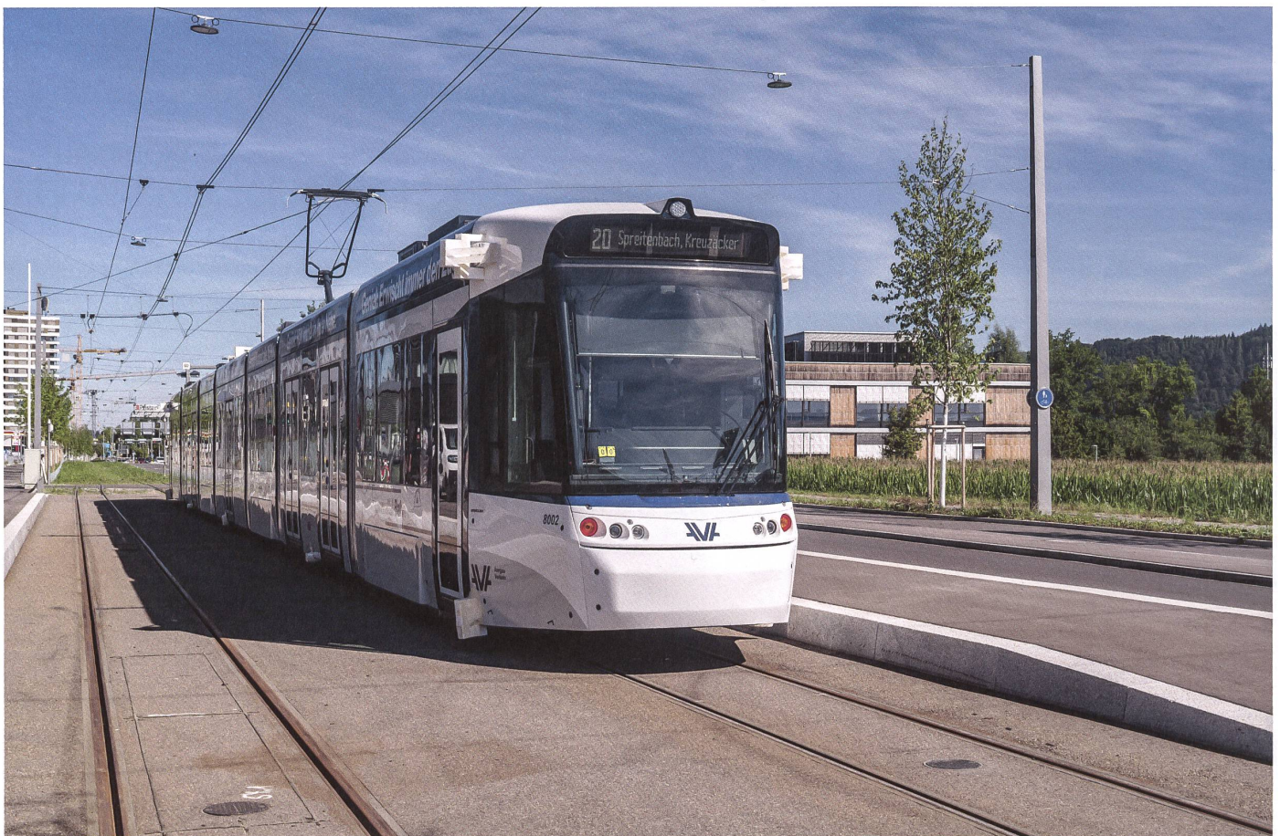
Spreitenbach: Die Limmattalbahn hält an der Station Kreuzacker, die die gleichnamige Überbauung erschliesst. →