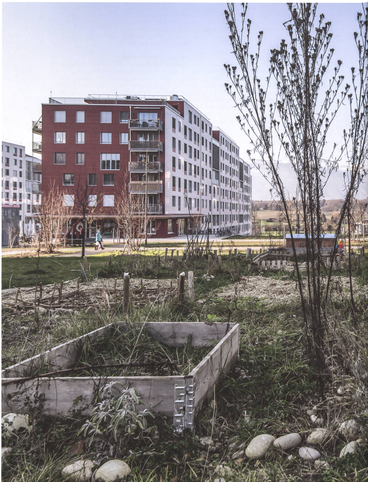
Von den gemeinschaftlichen Gärten schweift der Blick zwischen den Häusern hindurch in Richtung Jura.