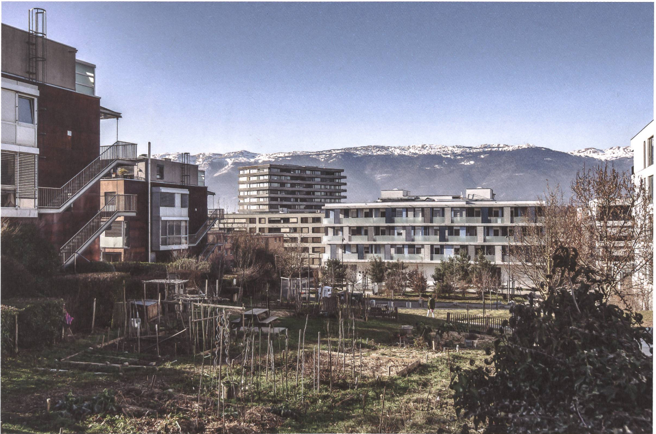
Vor der Jurakette erhebt sich das Hochhaus von Aebi Perneger & Associés.