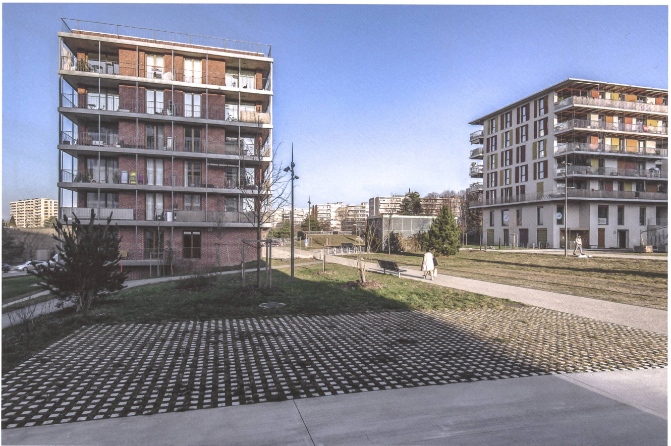
Die Esplanade des Récréations ist das Rückgrat des Écoquartiers.