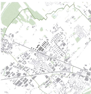
Das Écoquartier mitten in Meyrin.