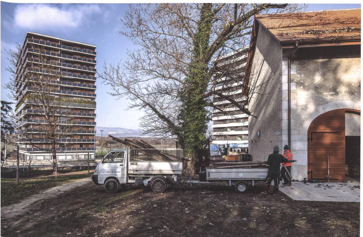
Die Ferme des Vergers bewirtschaftet die Landwirtschaftsflächen des Écoquartiers.

Die öffentlichen Räume bleiben weitgehend dem Langsamverkehr vorbehalten. Statt in einer Tiefgarage unter jedem Gebäude parkieren die Bewohnerinnen und Bewohner ihr Auto in einer Gemeinschaftsgarage und →