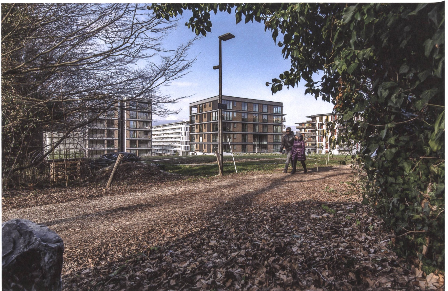
Der Chemin des Origines führt aus dem alten Dorfkern in Richtung Écoquartier.

Text: Werner Huber