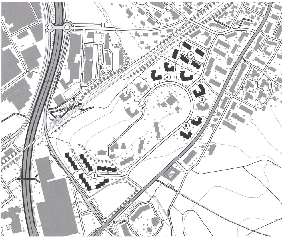
Mehrfamilienhäuser der Turidom am Balsberg in Kloten.