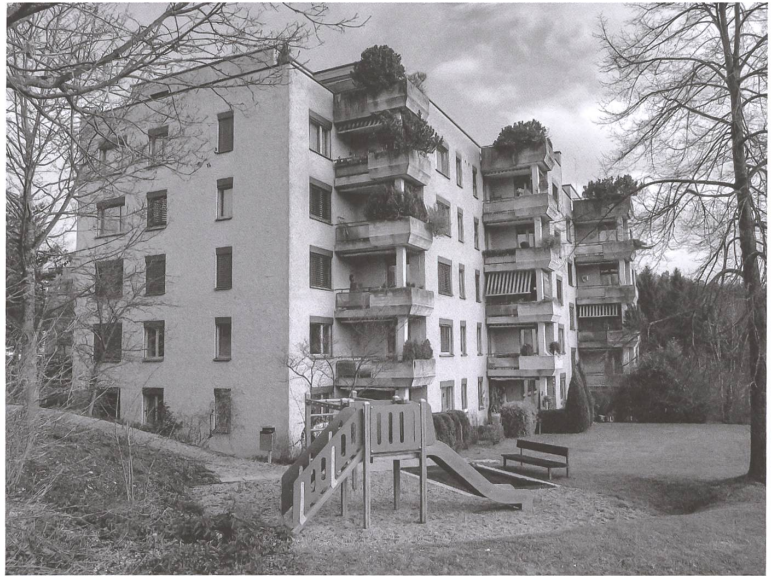
Am Balsberg 22-28