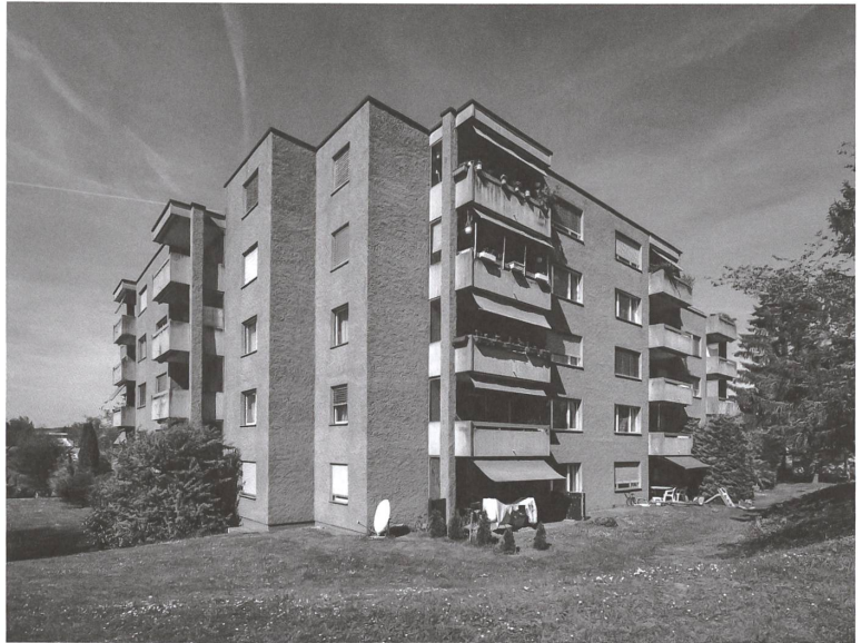
Am Balsberg 34–38

→ oberhalb des Verwaltungsgebäudes eine Siedlung mit 19 Mehrfamilienhäusern in fünf Reihen. Sieben Jahre später folgte eine Gruppe von fünf Doppelmehrfamilienhäusern am Balsbergweg, und zwischen 1976 und 1986 kamen sechs Blöcke oben auf dem Hügel dazu. 2003 wurde das Immobilienportfolio der diversen Swissair-Pensionskassen – mit insgesamt 400 Wohnungen allein auf dem Balsberg – in die Anlagestiftung Turidomus integriert. Seither wird es von Pensimo Management geführt.