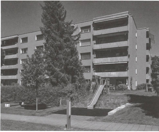
Am Balsberg 32