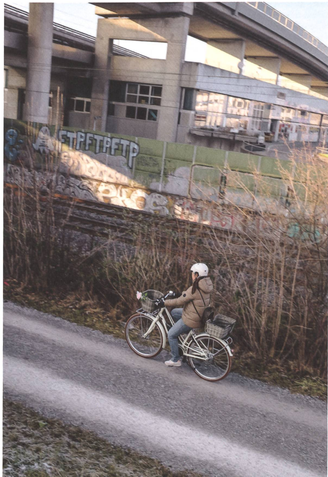
Das Velo wird im Glattal möglichst ohne Kreuzungen in die vielen bestehenden Verkehrswege eingeflochten.

Die Veloschnellroute schliesst im Endausbau an die Veloverbindung aus Oerlikon im Norden der Stadt Zürich an und führt via Wallisellen und Dübendorf bis ins Zürcher Oberland. Die Wichtigkeit einer koordinierten und integrierten Planung unterstreicht auch Christoph Lippuner vom Planungs- und Beratungsunternehmen EBP Schweiz, das für die Stadt Dübendorf das Fuss- und Veloverkehrskonzept entwickelt hat. Auf der Basis der Potenziale des Veloverkehrs erarbeitete das Büro ein umfassendes Netzkonzept für den Alltagsverkehr. Das Ziel war, eine Vermischung von Fuss- und Veloverkehr möglichst zu vermeiden, um konfliktfreie Routen zu schaffen. «Es ist wichtig, dass bereits auf Konzeptstufe auf eine klare Trennung geachtet wird», sagt Christoph Lippuner. «Bei der Umsetzung ist es meist zu spät dafür.»