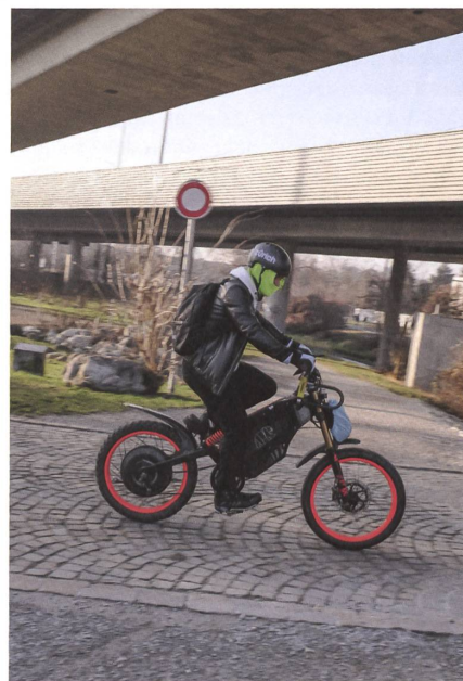
Mit etwas Schub fährt es sich leichter. Und schneller.