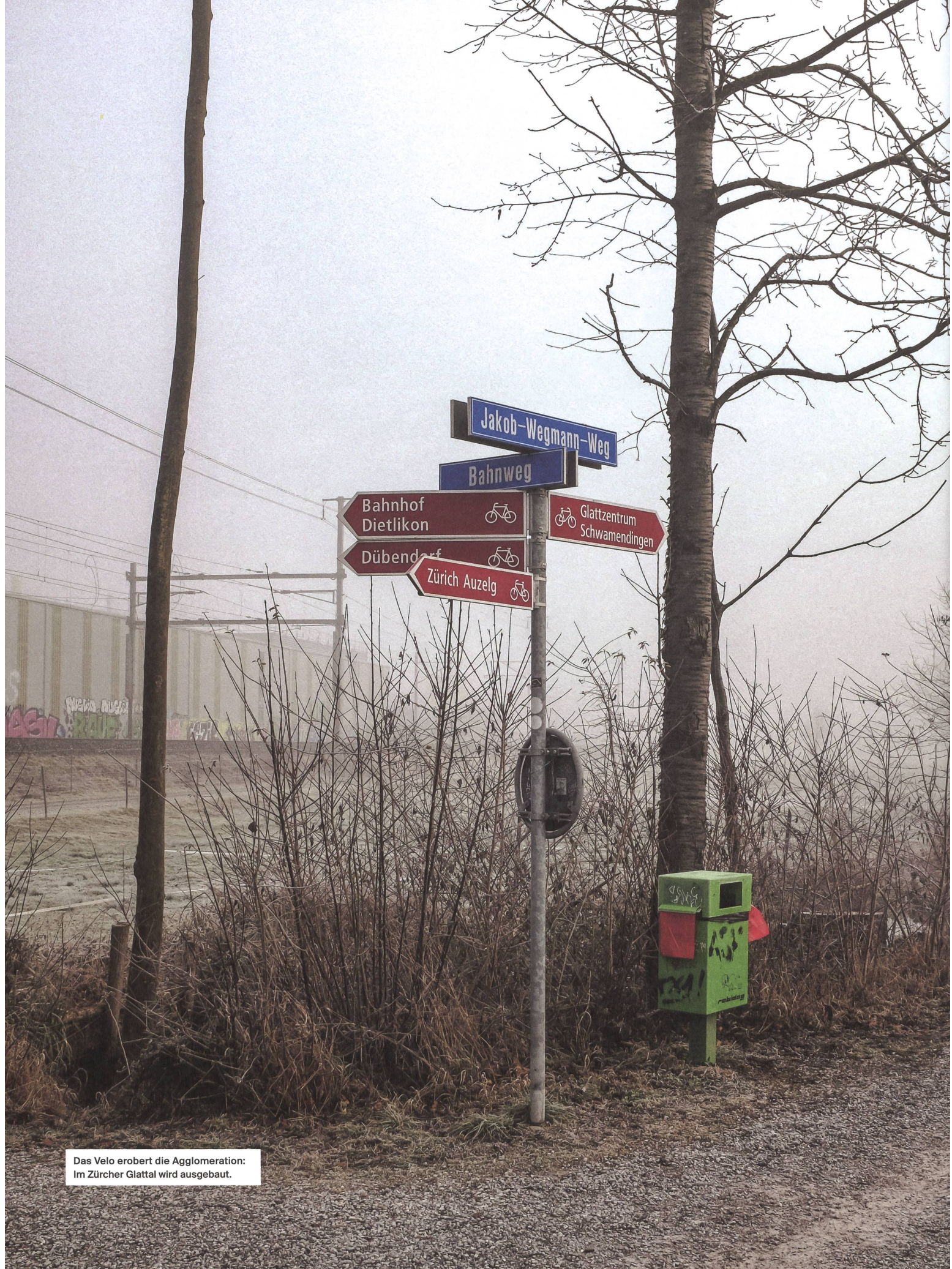
Das Velo erobert die Agglomeration: Im Zürcher Glattal wird ausgebaut.