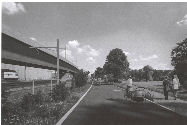
Die geplante Veloschnellroute durch Wallisellen zählt zu den ersten im Kanton Zürich. Visualisierung: Nightnurse Images, SBB