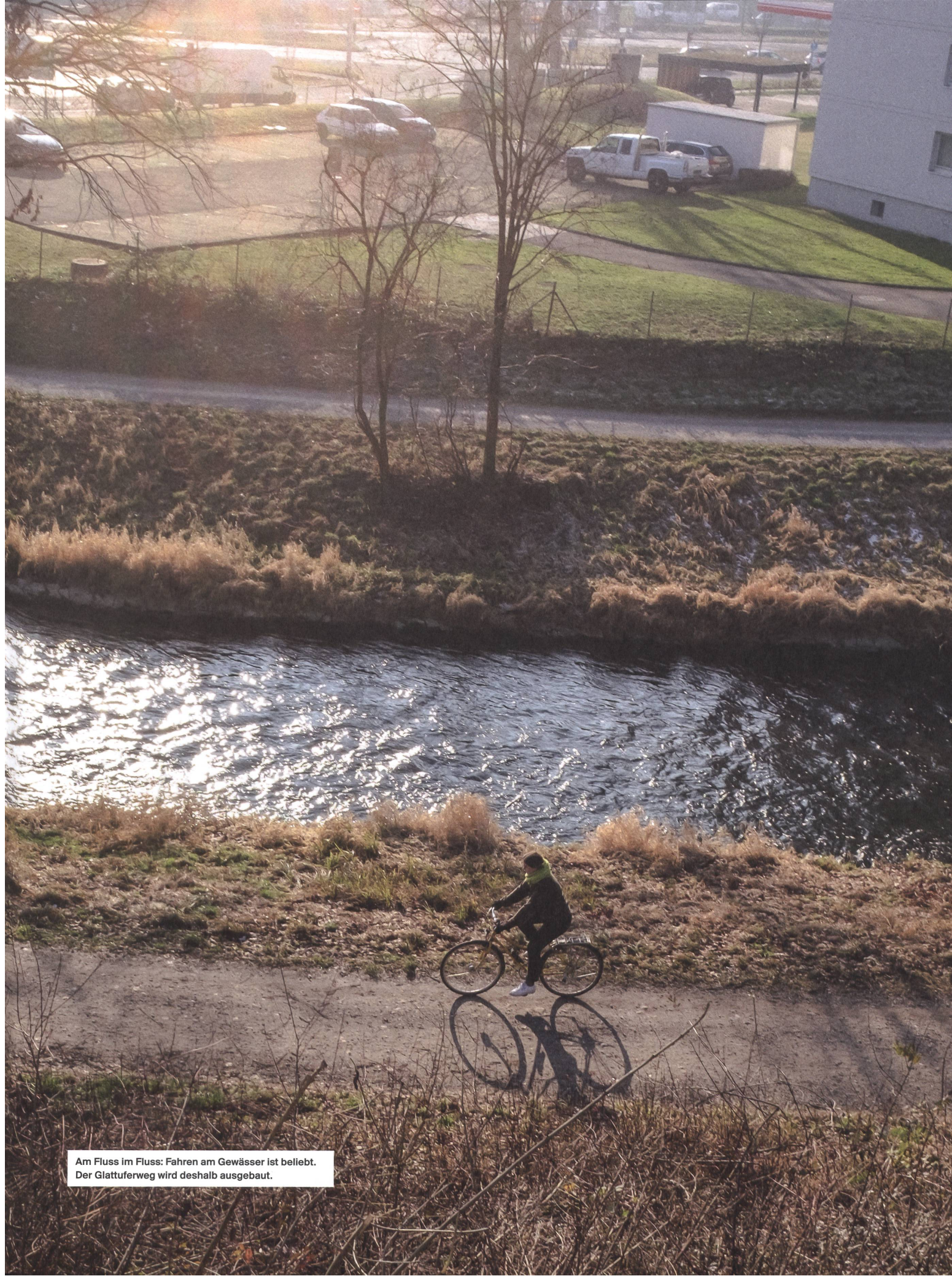
Am Fluss im Fluss: Fahren am Gewässer ist beliebt. Der Glattuferweg wird deshalb ausgebaut.