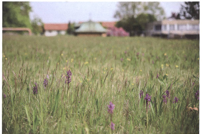
Orchideenmeer: Dach auf den Hallen des Seewasserwerks Moos in Zürich-Wollishofen.