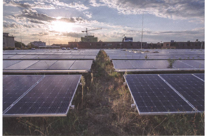
Extensive Begrünung und Photovoltaik lassen sich kombinieren, wenn die Pflanzen auch unter und zwischen den Panels wachsen können.