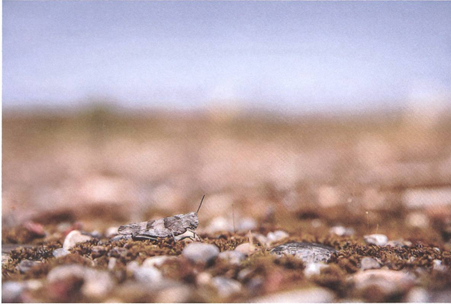
Auf begrünten Dächern leben Spinnen, Falter, Käfer, Schnecken und Heuschrecken wie die Blauflügelige Sandschrecke.