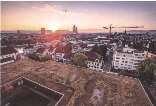
Auch das Dach des Basler Klinikums 2 ist zu einem Refugium der Artenvielfalt geworden. Es wird allerdings bald einem Neubau weichen.