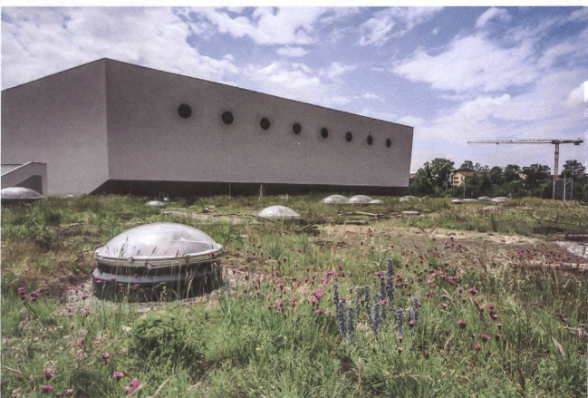
Biodiversität über den Köpfen: das Dach der Basler St. Jakobshalle.