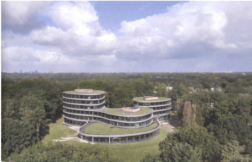
Die Triodos Bank beweist: Zirkuläres Bauen kann auch wie «normale» Architektur aussehen.