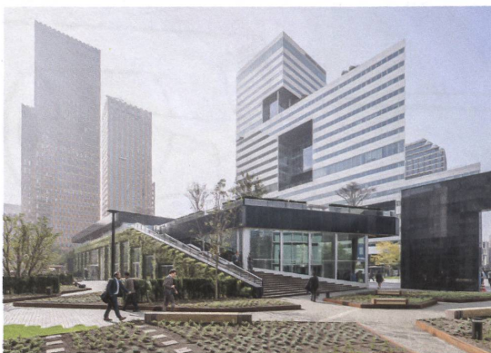
Am teuersten Ort in den Niederlanden steht der Ökopavillon Circl.