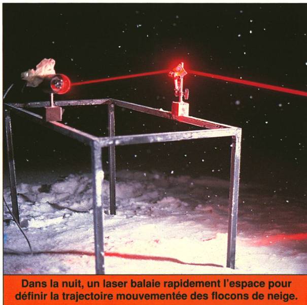
Dans la nuit, un laser balaie rapidement l'espace pour définir la trajectoire mouvementée des flocons de neige.

Résoudre isolément chaque cas de figure est illusoire : cinq ans ont été nécessaires aux chercheurs pour trouver la parade au Simplon ! D'où l'idée de simuler les congères dans un ordinateur. Mais avant d'en arriver là, il faut parvenir à mettre en équations le transport – au sol – de la neige par le vent. Et ce n'est pas une mince affaire ! En effet, les courants qui circulent au ras de terre n'ont rien à