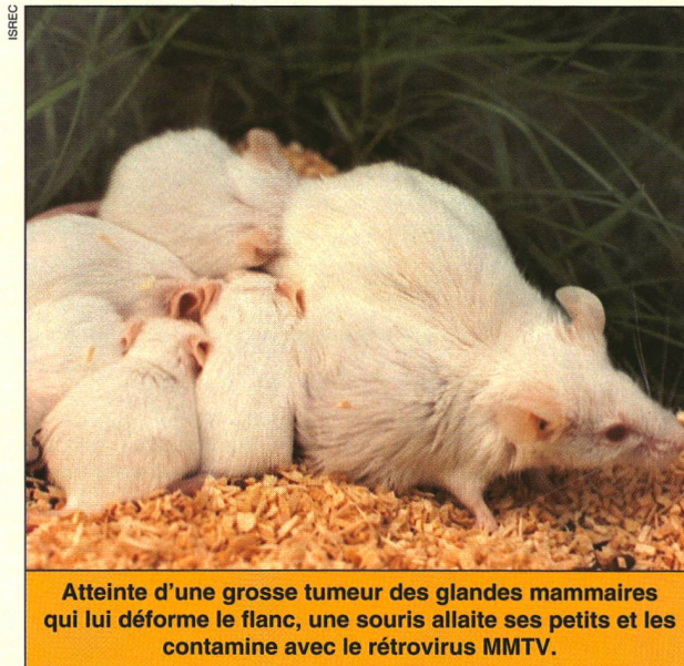
Atteinte d'une grosse tumeur des glandes mammaires qui lui déforme le flanc, une souris allaite ses petits et les contamine avec le rétrovirus MMTV.

Ces observations sur la souris, impossibles à faire sur l'homme ou sur les singes, sont particulièrement intéressantes. En effet, la transmission sexuelle du virus du sida