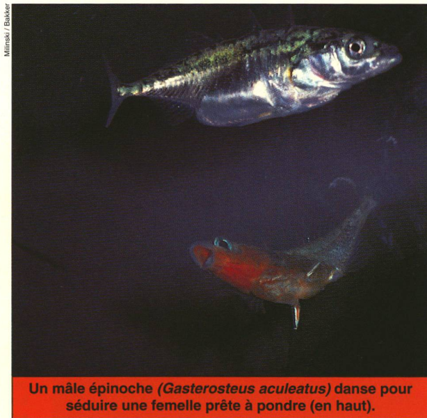
Un mâle épinoche ( Gasterosteus aculeatus ) danse pour séduire une femelle prête à pondre (en haut).

Les chercheurs de l'Institut de zoologie de Berne avaient alors suggéré que les poissons les plus colorés devaient posséder un caractère génétique particulier, les rendant résistants aux parasites. En effet, la fabrication de couleurs vives demande beaucoup d'énergie aux mâles.