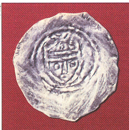
Recto: L'empereur Heinrich III d'Allemagne qui régna de 1039 à 1056. Verso: une église.

Extrêmement minces, elles mesurent à peine deux centimètres de diamètre, et pèsent moins d'un gramme. Leurs faces ont été frappées au poinçon de représentations d'églises, de personnages importants ou de croix. Vu la minceur des pièces, les motifs du recto et du verso s'interpénètrent fortement, rendant leur déchiffrement délicat.