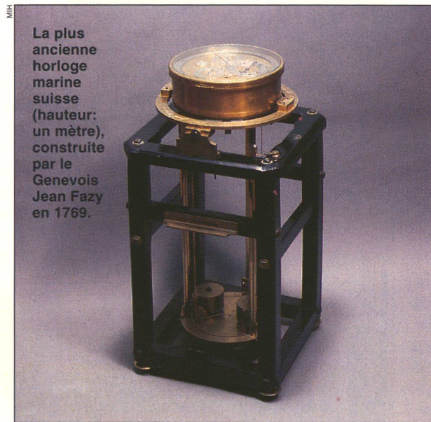
La plus ancienne horloge marine suisse (hauteur: un mètre), construite par le Genevois Jean Fazy en 1769.

En achevant sa recherche sur la « Contribution de la Suisse à la chronométrie de marine du 18 e au 20 e siècle », Estelle Fallet a comblé une importante lacune de l'histoire de l'horlogerie suisse. Pour y parvenir, elle a notamment examiné les archives cantonales et celles des Musées d'Horlogerie de La Chaux-de-Fonds et de Genève, ainsi que les documents des Observatoires de Neuchâtel et de Genève. Elle a aussi visité les fabricants de chronomètres. Par l'intermédiaire des sociétés d'amateurs d'horlogerie ancienne, elle a fait appel aux collectionneurs, ce qui lui a valu d'obtenir de