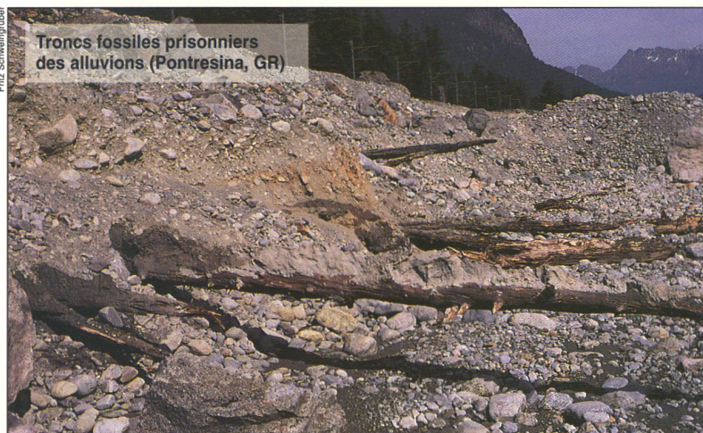
Troncs fossilisés prisonniers des alluvions (Pontresina, GR)