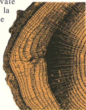
Pour un arbre de montagne, plus une cerne est épaisse et plus l'été correspondant fut chaud.

Quant à la dendrochronologie , c'est la science qui consiste à mesurer l'épaisseur et la disposition des cercles de croissance des arbres ( cernes ). «Morts ou vivants, poussant sur les Alpes ou sur d'autres massifs, les arbres nous fournissent de nombreuses indications sur les températures estivales du dernier millénaire», souligne Fritz Schweingruber, de l'Institut fédéral de recherches sur la forêt, la neige et le paysage, à Birmensdorf. «Nous sommes sur le point d'achever une étude qui retrace une période de 8000 ans, avec des arbres provenant des Alpes, du Nord de