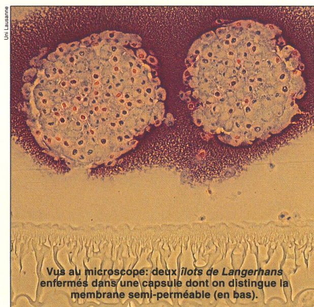
Vus au microscope: deux îlots de Langerhans enfermés dans une capsule dont on distingue la membrane semi-perméable (en bas).