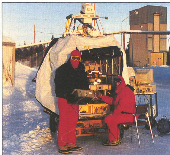
Base de Kiruna (Suède), température de -28°C: derniers réglages des instruments que la nacelle du ballon emportera dans la stratosphère.

Les chercheurs concluent ainsi que le méthane est un bon indicateur de l'étendue des zones humides sur la Terre – un élément important pour