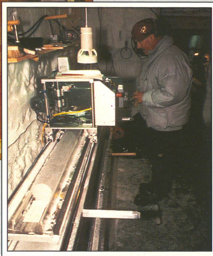
A droite. Le Prof. Stauffer découpant une carotte de glace par -25^{\circ}\text{C} .

fondeurs, il n'était pas question de les toucher du doigt: ce simple contact aurait provoqué un choc thermique qui aurait fait éclater la glace en mille morceaux. Aussi, pour la laisser réajuster ses tensions internes, les tronçons de carotte ont d'abord été stockés sur place durant une année (à -25^{\circ}\text{C} ), avant d'être acheminés vers l'Europe.