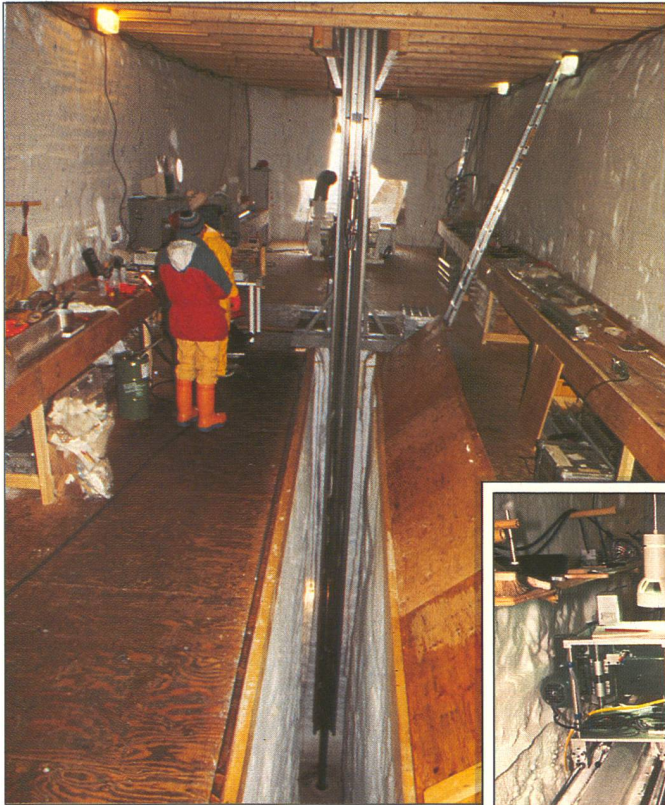
En haut. Centre névralgique du projet GRIP: le dôme qui abritait les instruments de forage.