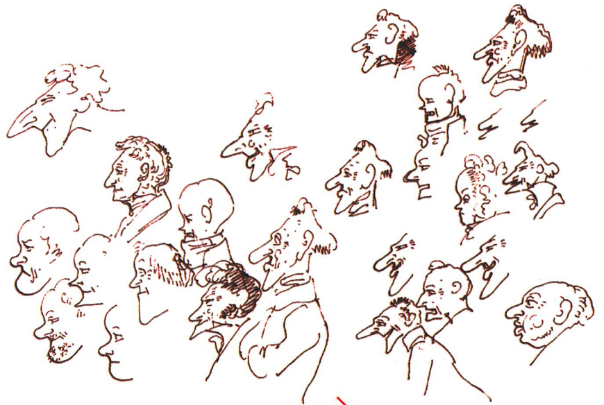
Études de profils pour l'album intitulé «Monsieur Crépin». Le personnage indiqué par le trait sera finalement retenu.

L'analyse de la correspondance et des écrits de Töpffer révèle que, par la suite, il s'est habilement servi des commentaires élogieux de Goethe pour donner du crédit à ses albums. Lorsqu'il en parle lui-même, il emploie les termes de «griffonnades» ou de «bêtises». Mais ses propos jouent sur l'ambiguïté, et l'on sent bien un désir d'en souligner la nouveauté. S'il n'en avait pas été fier, il n'aurait pas publié ses sept bandes dessinées sous un demi-anonymat: il signait «R.T.», ce qui ne trompait personne dans la République genevoise où son style était connu.