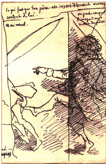
Ce dessin révèle comment Töpffer découvre le langage de la bande dessinée. Il a d'abord représenté en entier le père qui botte le derrière de son fils. Puis il a choisi de ne laisser que son pied et sa main. Cette case revient régulièrement dans l'album, jouant sur le comique à répétition (manuscrit de l'«Histoire de Jacques», 1844).