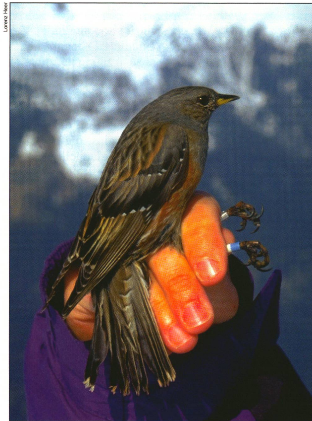
Cet Accenteur alpin porte des bagues de couleurs personnalisées qui permettent de l'identifier à distance.

ou trois femelles, et tout mâle «étranger» en est chassé. Ces territoires étant établis, une farouche rivalité s'installe entre les mâles d'un même clan lorsque les femelles deviennent fécondables, ce qui arrive une première fois vers la mi-mai, puis une deuxième en juillet.