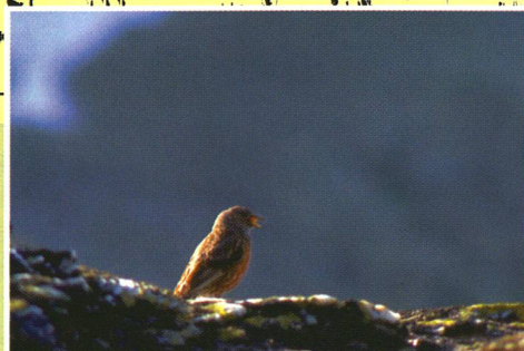
Sonagramme de E. Tretzel d'après un enregistrement sonore de A. Aichhorn (tiré de Glutz von Blotzheim & Bauer, Handbuch der Vögel Mitteleuropas 10, Aula-Verlag, Wiesbaden).

Dans un guide ornithologique célèbre, on dit que «le chant de l'Accenteur alpin est un gazouillis soutenu, au sol ou en cours de vol nuptial, rappelant l'alouette des champs: Trri-trui-tuituitui-trri...» Cette retranscription donne un pâle reflet du plus mélodieux des oiseaux de l'alpe. Aussi, les ornithologues emploient les sonagrammes , des graphiques destinés à représenter le chant des oiseaux. Mais, pour le profane, décrypter un sonagramme, c'est comme lire une partition de musique sans avoir appris le solfège! Pour se rendre compte des vocalises du «ténor des alpages», il vaut donc mieux aller le matin sur l'alpe, entre mai et juillet.