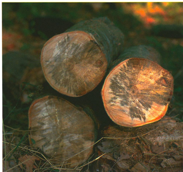
Noircissement du bois: le chancre coloré se propage jusqu'au cœur des troncs.

Les chercheurs ont essayé la juglone sur les feuilles de platane: l'effet est foudroyant! «Avec elle, les feuilles noircissent en quelques heures. Alors que la naphtalénone commence à agir