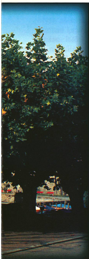
Université de Neuchâtel