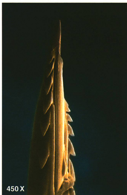
Contrairement au dard de la guêpe, le dard de l'abeille est barbelé: il reste pris dans la peau humaine.

désensibilisations qui utilisent des extraits de venin, un vaccin à base de peptides devrait réduire considérablement la durée du traitement qui dure habituellement trois ans», explique Giampietro Corradin. «Ces peptides peuvent être administrés en grande quantité aux patients, et beaucoup plus fréquemment que des extraits de venin. Avec eux, on devrait aussi écarter en grande partie le risque de réaction allergique