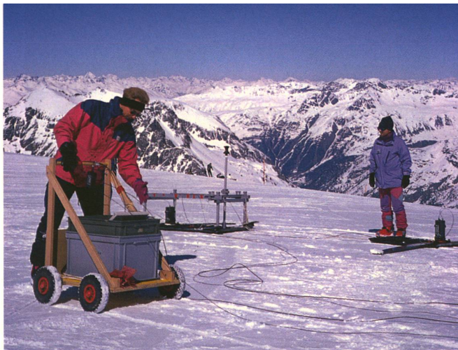
Essais sur la glace: les chercheurs de l'EPF de Zurich étudient les couches géologiques proches du sol à l'aide d'un géoradar mobile.

Ce «géoradar» opère à très hautes fréquences (10 à 1000 mégahertz) et permet ainsi d'atteindre des résolutions de 10 centimètres. En l'appliquant en plusieurs points, à distances régulières, on obtient un grand nombre d'images des structures sous-jacentes (des matériaux possédant des propriétés électriques différentes sont représentés en couleurs différentes). Ces images partielles peuvent être rassemblées en une vue d'ensemble à trois dimensions, ceci sans percer un seul forage ni recourir à aucune charge explosive.