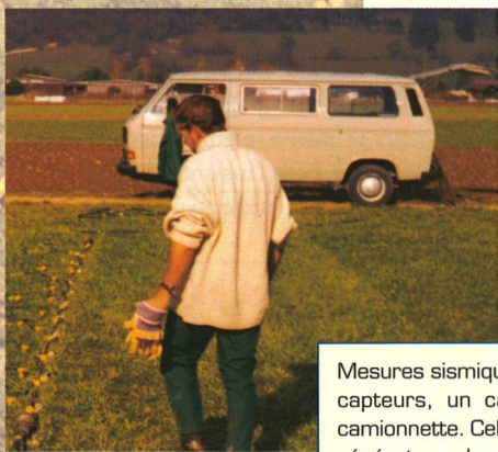
Mesures sismiques avec des capteurs, un câble et une camionnette. Celle-ci abrite le générateur de vibrations et l'ordinateur qui les interprète.

Un groupe de l'EPF de Zurich, dirigé par le professeur Alan Green, s'intéresse aux couches géologiques situées juste au-dessous de la surface du sol, jusqu'à une profondeur de 300 mètres; il explore la structure de ces formations et obtient de ces dernières des images à trois dimensions, au moyen d'une technique fiable et avantageuse, la tomographie. Une méthode similaire est utilisée depuis longtemps en imagerie médicale, par exemple pour localiser avec précision, sans intervention chirurgicale, une petite tumeur dans le cerveau.