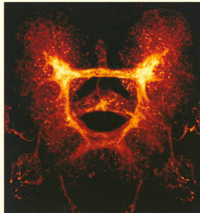
Le cerveau de la mouche drosophile est grand comme un centième de tête d'épingle.

La recherche neurologique s'intéresse de très près aux mécanismes moléculaires et génétiques qui commanderaient le développement du cerveau humain. Un groupe de