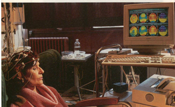
Une patiente passe un examen électro-encéphalographique dans le cadre d'un test sur la maladie d'Alzheimer: en Suisse, ces tests sont strictement contrôlés.

Le passage des essais en laboratoire et des expériences sur les animaux à l'utilisation sur l'homme est la phase la plus délicate d'un médicament avant son arrivée sur le marché. Un règlement et des comités d'éthiques veillent au bon déroulement de cette transition.